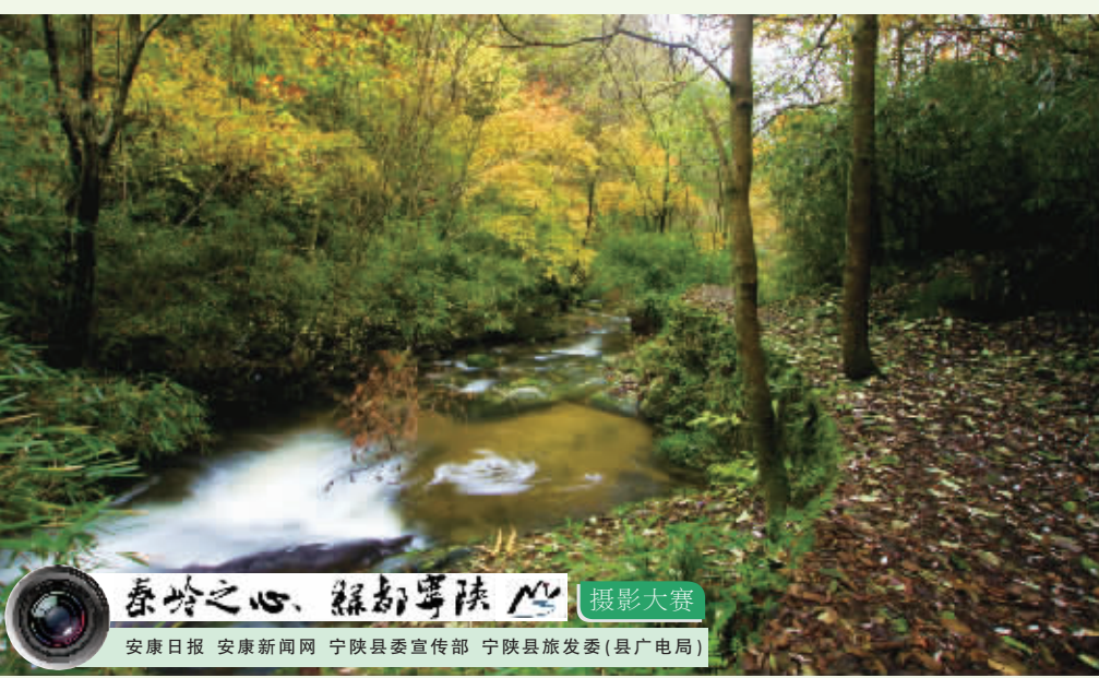
秦岭之心·秦巴明珠·摄影大赛 安康日报 安康新闻网 宁陕县委宣传部 宁陕县旅发委(县广电局)

瀑布从悬崖顶上的裂隙中飞流之下,倾泻崖下深潭,形成水帘,散出一派迷离的银光。瀑布如阵阵沉雷,借助水潭崖壁的回音,演奏出非凡雄伟的乐章。水雾弥漫,如烟如幻,其色其声,使人陶醉。走进瀑边,备感清凉透彻。远观