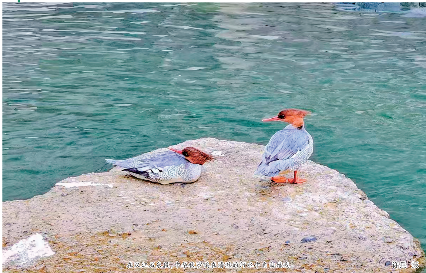
在汉江石泉段,中华秋沙鸭在清澈的河水中自由嬉戏。