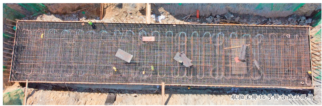
航拍主桥16号桥台施工现场