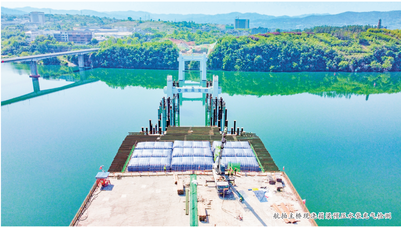
航拍主桥现浇箱梁顶水袋充气检测