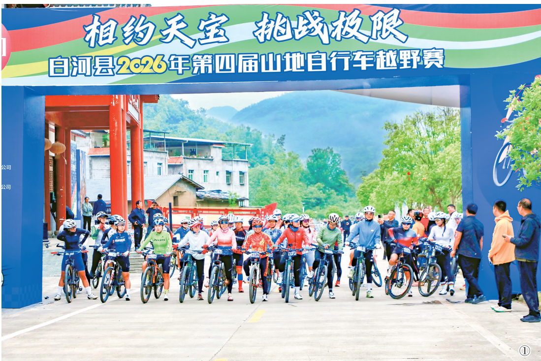
相约天宝 挑战极限 白河县2026年第四届山地自行车越野赛