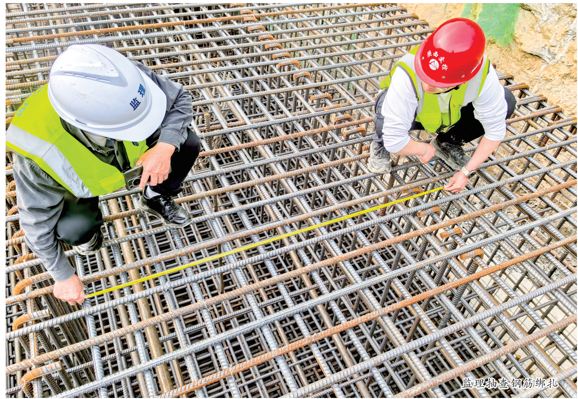
监理抽查钢筋绑扎