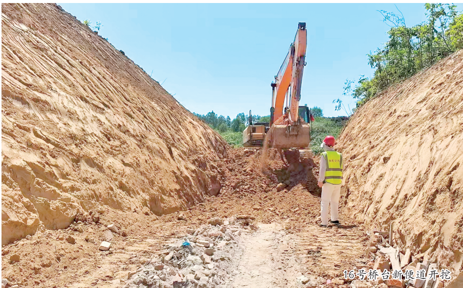
16号桥台新便道开挖

“五一”假期，安康大地处处涌动着实干热潮。新关庙汉江大桥项目建设现场机器轰鸣，广大建设者坚守施工一线，抢抓晴好天气赶工期、抢进度，以奋斗姿态奏响劳动赞歌。