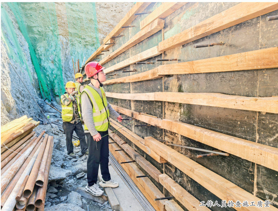
工作人员检查施工质量