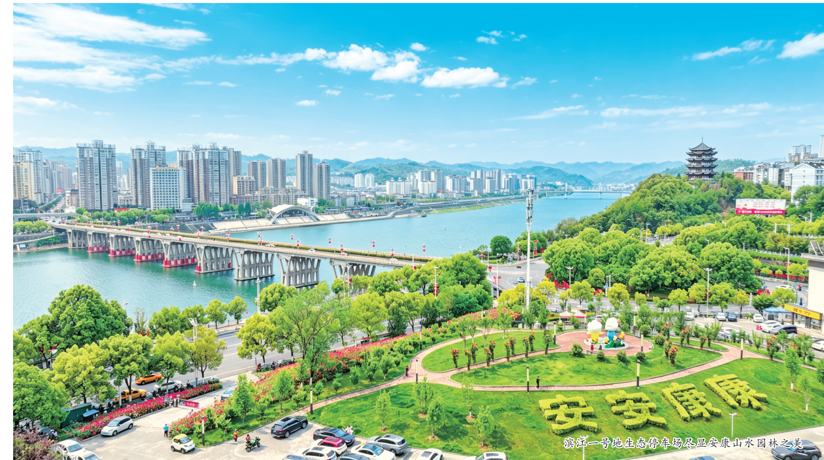
滨江一号地生态停车场尽显安康山水园林之美