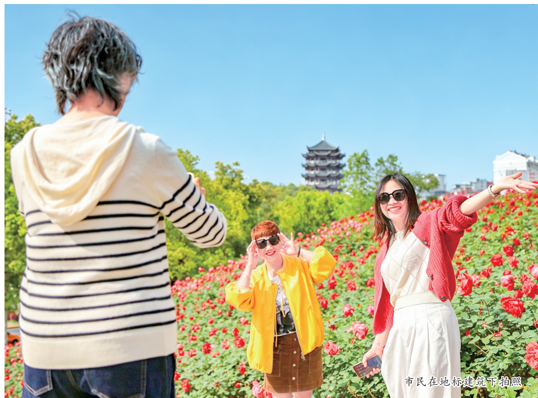
市民在地标建筑下拍照