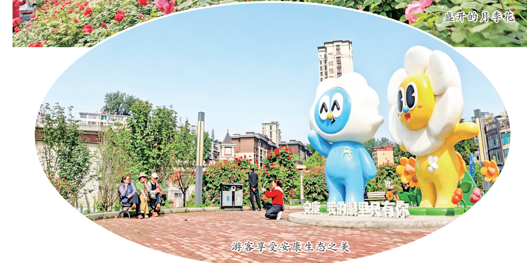
游客享受安康生态之美