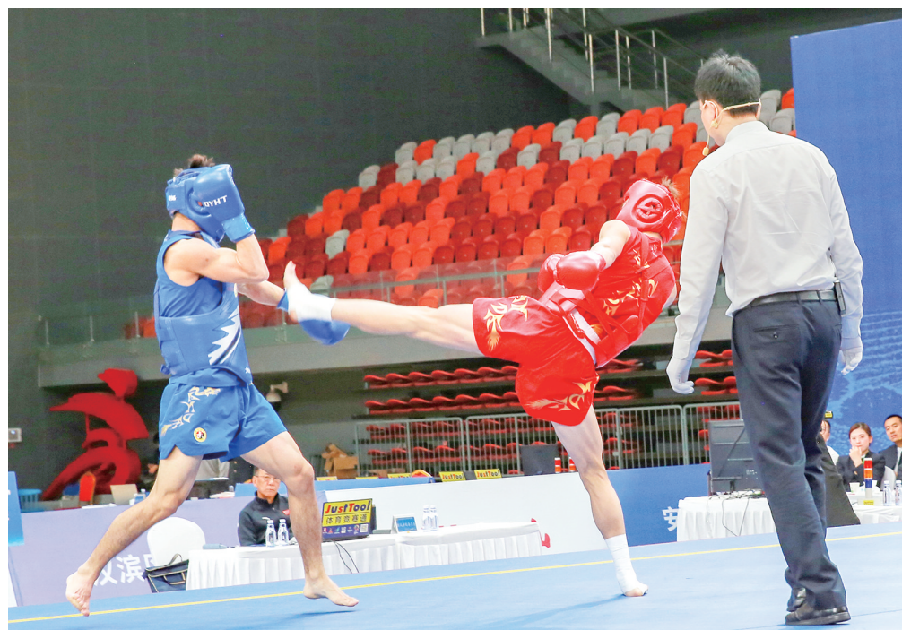
4月15日，2026年全国武术散打锦标赛暨第二十届亚运会武术散打项目选拔赛(男子赛区)进入第6天。据悉，当日进行了男子56、65、70、80、100及100公斤以上级个人项目比赛。