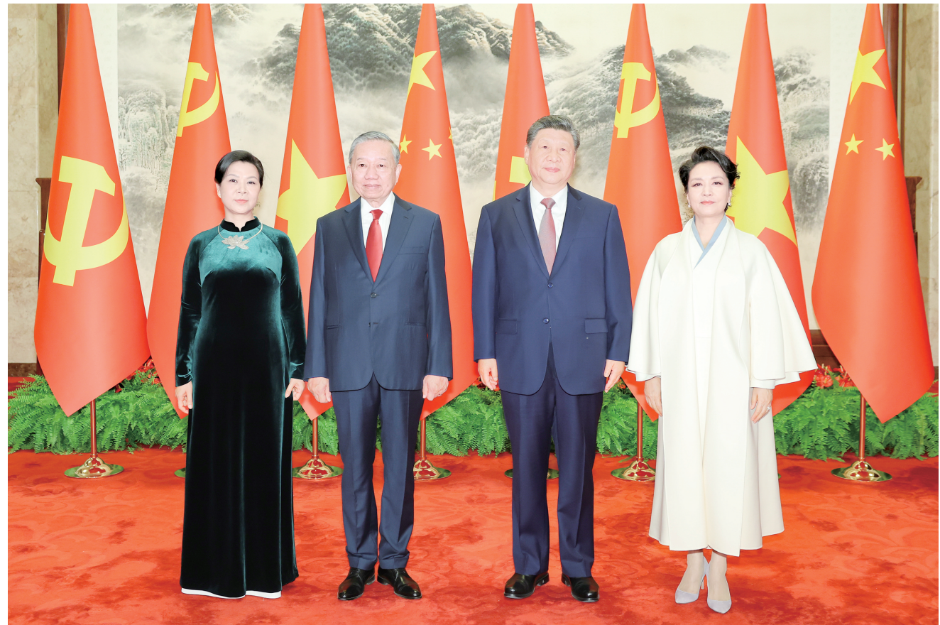
4月15日上午,中共中央总书记、国家主席习近平在北京人民大会堂同来华进行国事访问的越共中央总书记、国家主席苏林举行会谈。这是会谈前,习近平和夫人彭丽媛同苏林和夫人吴芳瑞合影。