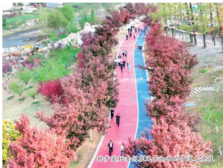
跑步爱好者们在风景如画的步道上竞跑

本报讯(通讯员 王潇 柯晗)近日,安康高新区2026年“快乐奔跑·安康真好”文体旅商系列活动之踏青健康跑在安康桃花源举行。