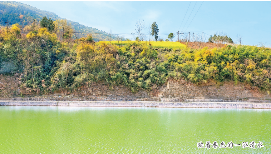
映着春光的一泓清水