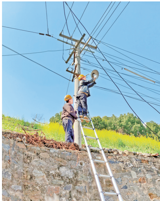
工作人员在汉滨区江北办中渡社区安装路灯

近日，安康市市政园林处持续深化“我为群众办实事”实践活动，坚持城乡一体、双向发力，全力保障群众出行安全与城市照明稳定。针对汉滨区江北办中渡村夜间照明缺失问题，该处第一时间现场勘查、制定方案，迅速增设便民路灯，彻底解决乡村道路夜间“摸黑路”难题，消除出行安全隐患。面对风雨天气造成的城区景观照明故障，市政园林处连夜作战，及时抢修金州路雷神殿十字景观灯，高效恢复城市夜间照明。