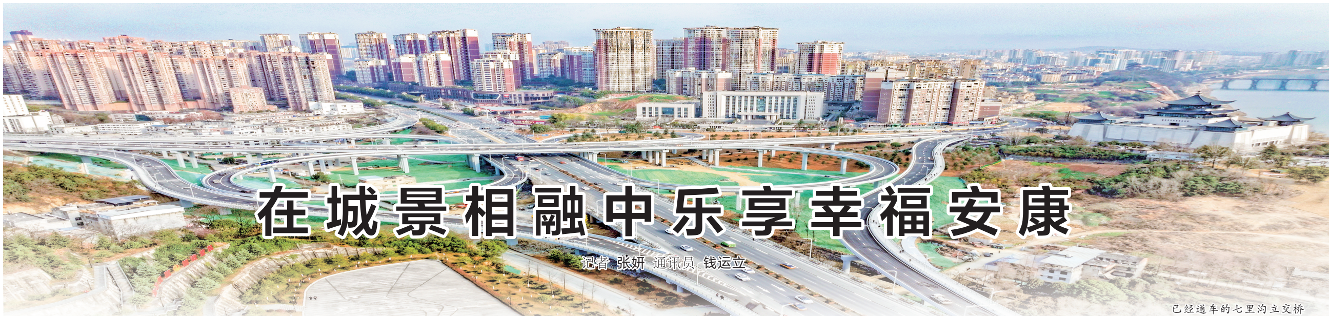
已经通车的七里沟立交桥