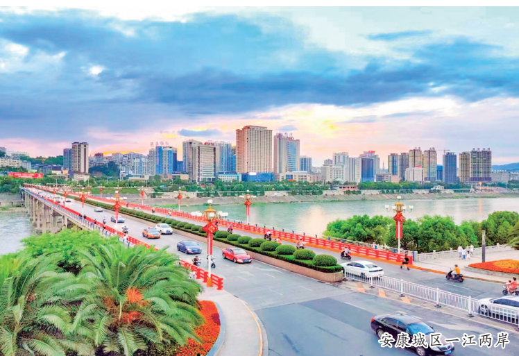
安康城区一江两岸

春日的安康城，江面薄雾轻笼，一江两岸的公园里，岸柳吐翠，樱花如云。春风拂过，城市渐渐苏醒，一江两岸错落有致的楼宇、广场、街道和晨跑的人，都在融融春色里舒展筋骨。春天的温柔与城市的繁华在这座小城相遇，一派城景交融的勃勃生机，让钢筋混凝土也有了诗意。