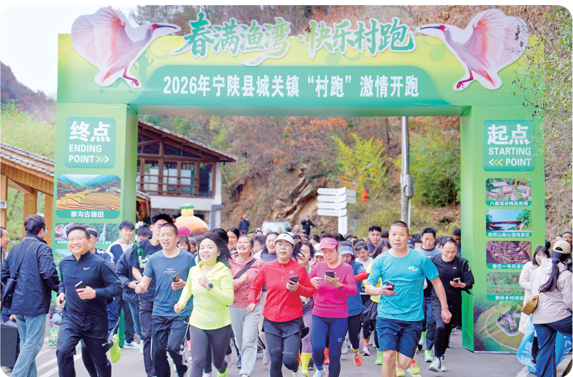
“春满渔湾·快乐村跑”活动开跑

春回秦岭，景润宁陕。随着气温回升，宁陕县春季旅游持续升温，各类文旅活动轮番上演，特色体验精彩纷呈，全县旅游市场呈现旅游热、消费旺的良好态势。各地游客循着春日气息，走进宁陕，开启一场沉浸式踏春之旅。 3月21日，“春满渔湾·快乐村跑”活动在城关镇渔湾村启幕。本次赛程沿渔湾村环形道路跑5圈，全程约9公里。路线从小火车站台出发，途经不晚小店、稻田舍民宿、渔湾村委会、渔湾桥头、石头广场，最终返回起点。