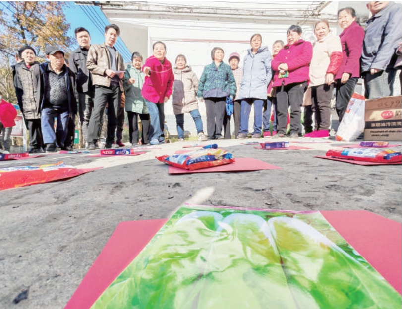
为弘扬尊老敬老传统美德,营造养老孝老敬老的社会氛围。11月28日,安康市天然林保护中心党支部联合紫阳县高桥镇双龙村党支部,开展了“情暖夕阳、爱暖桑榆”村民乐老年人趣味运动会。

本报讯(通讯员 陈语歌)中国人寿财产保险股份有限公司安康市中心支公司自承担道路交通事故社会救助基金管理运营职责以来,持续深化“警保联动”模式,搭建交通事故高效救治“绿色通道”,累计接案132件,垫付群众“救命钱”511.75万元。 该公司秉持“人民至上、生命至上”的理念,积极与公安交警、卫生健康部门对接,深化“警医保”联动协同,率先在安康市中医医院挂牌全市首家“警—医—保”联动定点医院,并与全市10家医院达成合作,建立起事故交