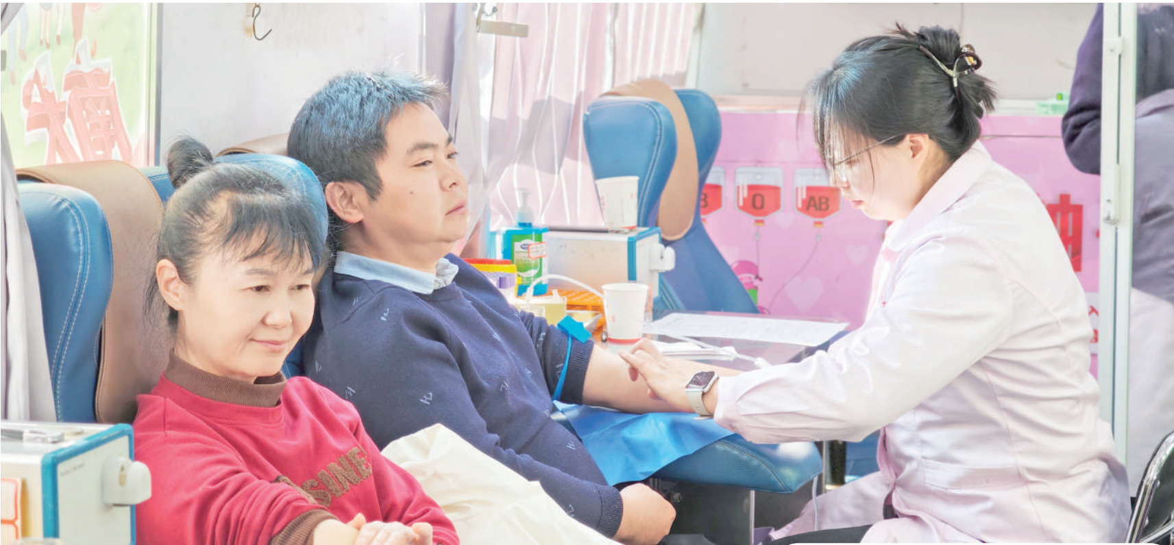
11月28日,汉阴县委、县政府组织开展了无偿献血活动。当日,从机关干部到普通群众,70余名爱心人士参与无偿献血,以实际行动为生命续航,彰显了县城文明新风尚。