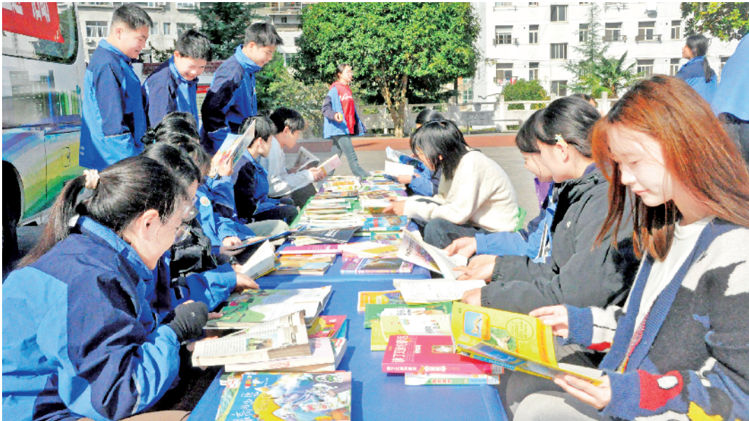
为全面提升全民阅读质量,扩展全民阅读范围,今年紫阳县推出了“阅读·悦·美”系列图书流动车进社区、进校园、进军营、进机关、进乡村“五进”活动。图为二月二日,紫阳县图书馆图书流动车走进高桥桥初级中学。

我市将持续深化博士后创新基地建设,进一步完善平台运行机制,强化服务保障力度,充分发挥基地人才集聚、科研攻坚、成果转化功能,推动各创新基地与高校、科研院所深度合作,加速高层次人才培育与科研成果落地见效,为安康经济社会高质量发展注入更强人才活力与创新动力。