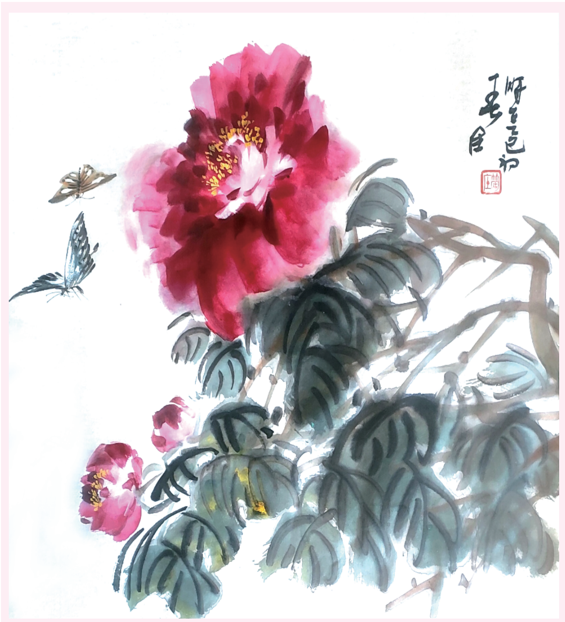
牡丹花开 陈荣临作