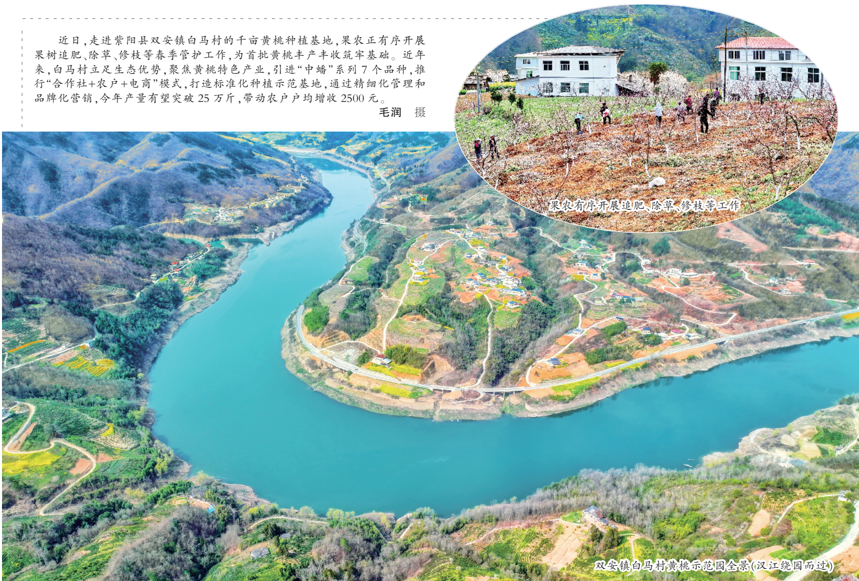
近日,走进紫阳县双安镇白马村的千亩黄桃种植基地,果农正有序开展果树追肥、除草、修枝等春季管护工作,为首批黄桃丰产丰收筑牢基础。近年来,白马村立足生态优势,聚焦黄桃特色产业,引进“中蜂”系列7个品种,推行“合作社+农户+电商”模式,打造标准化种植示范基地,通过精细化管理和品牌化营销,今年产量有望突破25万斤,带动农户户均增收2500元。

汉阴县各社区党组织利用每季度与“双报到”单位党组织召开党建联席会议、社区党员大会、群众代表大会等契机,对实事办理情况进行通报,主动接受群众监督。同时,在年底开展效果同评会议,由社区党组织组织党员、群众对“一年10件实事”完成情况进行满意度测评,测评结果作为报到单位“双评议”的重要依据。