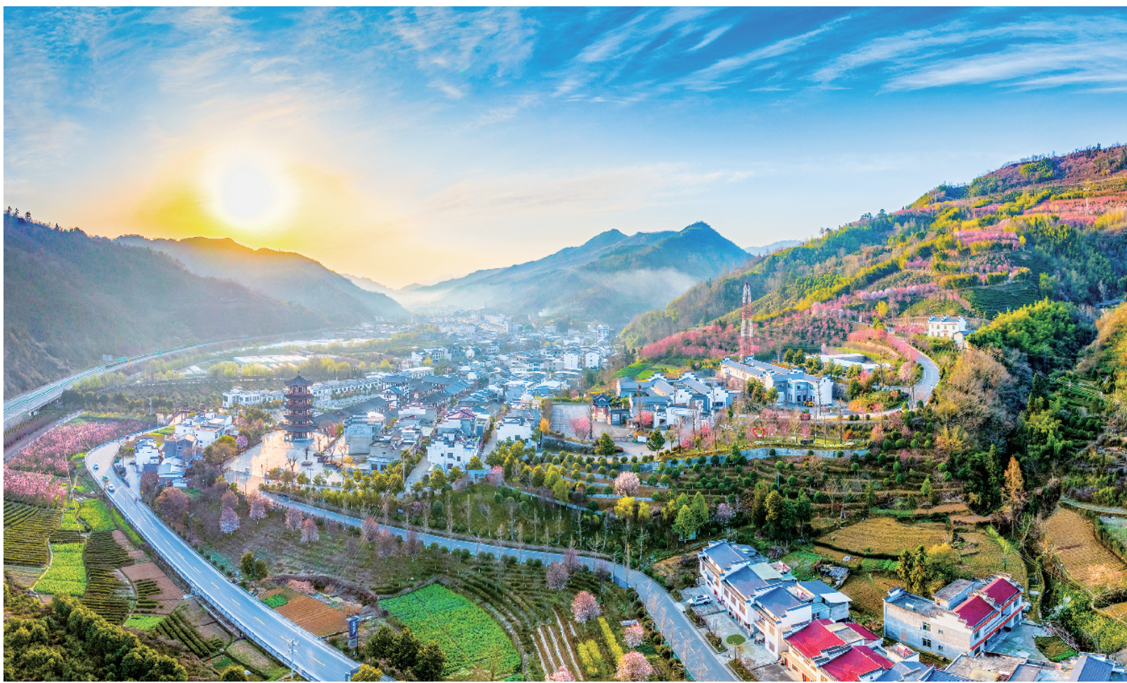
阳春三月,平利县长安镇春意盎然,茶香携着花香扑面而来,徽派民居与山水田园交相辉映,处处洋溢着勃勃生机。

接下来,市科技局将继续利用好“三区”科技人才、科技特派员等资源,持续动员科技人才深入生产一线开展科技服务,建立常态化服务机制,根据不同季节、不同作物生长周期,有针对性地开展技术指导,为农业丰产增收贡献科技力量。