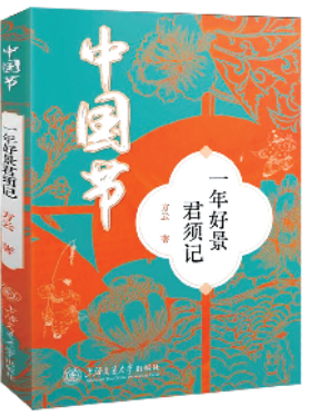
《中国节——一年好景君须记》

中国传统节日是中华文化的重要载体，是一个在时空序列轴上涵括天文地理、人文历史、伦理道德、政治经济、文学艺术、习俗风尚等多方面的宏大的知识体系，体现着中华文化的丰富性和多样性，是历史演进中的“人文化成”。中国的传统节日不仅是知识体系，也因其蕴含着诸如热爱生命、追求健康、敬祖孝先、尊老爱幼、弘扬正义、贵和尚美、团结和睦的中华传统美德，更是我们中华民族精神的写照与民族情感的凝结。