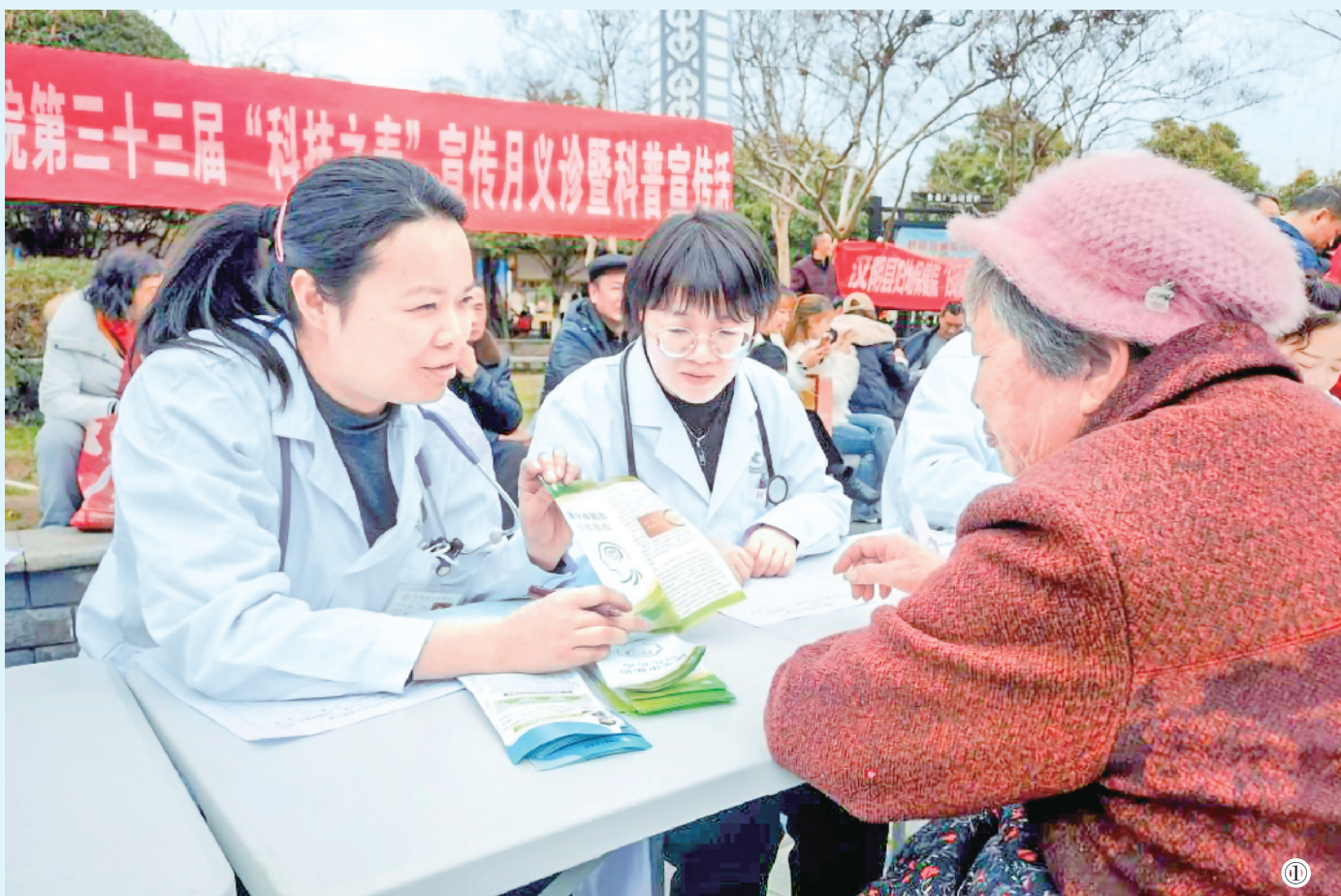
① 3月14日,汉阴县人民医院组织胸痛中心、卒中中心及康复科医护人员在城南凤凰广场开展第三十三届“科技之春”宣传月义诊暨科普宣传活动,活动以“早识别、早干预、早康复”为主题,通过专业诊疗、健康科普等形式,为群众提供健康服务。