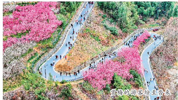
赏梅的游客纷至沓来