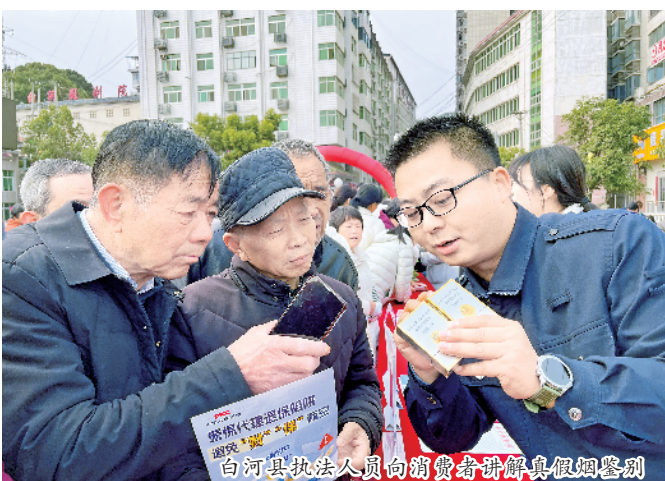
白河县执法人员向消费者讲解真假烟鉴别

本报讯(通讯员 丁肇玺)为切实维护国家利益和消费者权益,自2月28日起,安康市烟草专卖局围绕本年度消费者权益保护日“共筑满意消费”活动主题,精心策划了一系列普法宣传活动,旨在提升消费者的维权意识和能力,推动平安安康、法治安康建设。