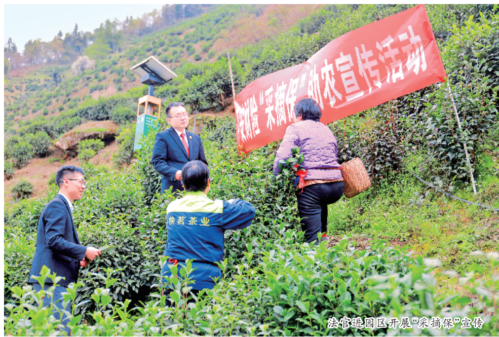
法官建园开展“采摘保”宣传

近年来,安康市两级法院以“一书一报一函”机制为抓手,通过综合类司法建议书推动管理规范、以诉前简报助推党委政府精准治理、以风险提示函帮助风险对象预防和降低各类风险,探索出一条司法审判与社会治理深度融合的创新路径。数据显示,2024年,全市法院金融借款合同纠纷等类型案件同比下降明显,万人成讼率下降11.05%,综合治理类司法建议采纳率达100%,基层治理呈现“纠纷降、化解快、效果稳”的良好态势,全市法院人民群众满意度99.73%,位居全省第一。