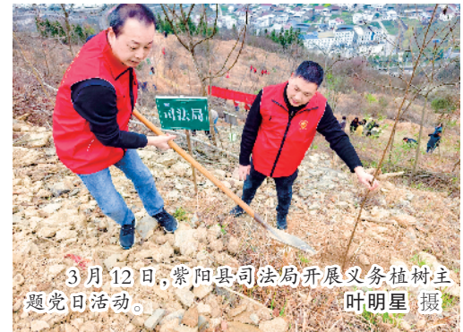
3月12日,紫阳县司法局开展义务植树主题党日。