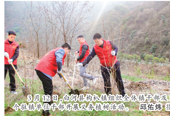
3月12日,白河县柞树镇组织全体镇干部及5个驻镇单位干部开展义务植树活动。