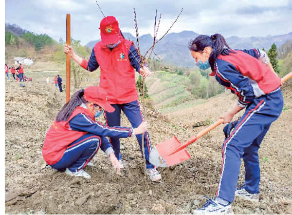
3月12日,石泉县云雾山镇中心小学组织少先队志愿者开展义务植树活动。

人民代表大会常务委员监督法》修改的主要内容,在“精准发力”上下功夫,以正确监督把准方向,以有效监督推动落实,以依法监督彰显权威,真正把法律要求转化为服务大局、惠及民生的实际成效。要坚持多方联动,形成推动贯彻落实强大合力。市县人大要进一步强化“一盘棋”意识,主动加强与“一府一委两院”及职能部门的沟通对接,通过制度化、机制性联动,推动人大监督与部门工作深度融合,形成问题共答、同向发力的生动局面。要充分发挥代表作用,激发履职活力。认真办好《中华人民共和国全国人民代表大会和地方各级人民代表大会代表法》学习宣传贯彻工作,聚焦市委推动高质量发展的“七个加力提效”工作部署,强化主体意识,加强履职能力培训,办好代表建议,做好票决制等工作,为推动人大工作高质量发展、更好服务全市工作大局贡献智慧和力量。