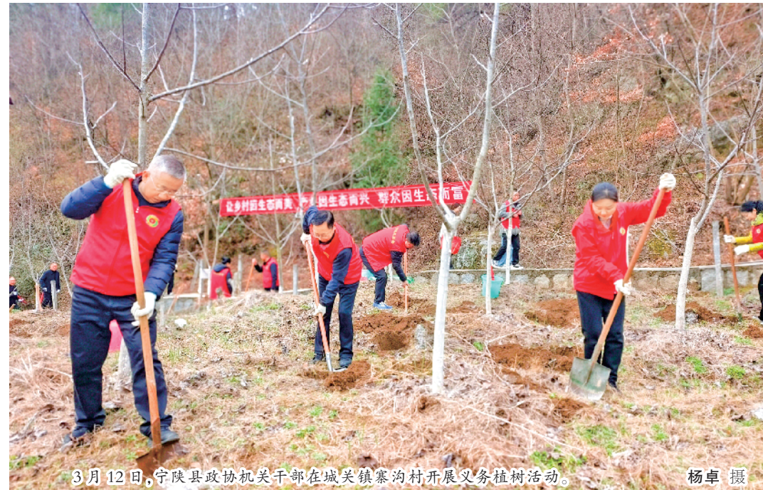
3月12日,宁陕县政协机关干部在城关镇寨沟村开展义务植树活动。