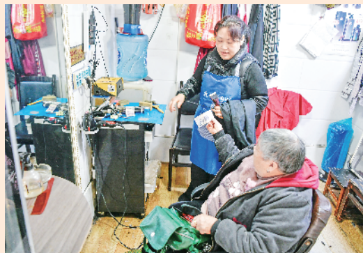
顾客(前)在攀洋美发店理发后付款。

本报讯(通讯员 曹英元 陈博)近年来,岚皋县深入实施孝义善举培育工程,坚持“四个聚焦”,大力弘扬孝悌、勤俭、诚信、好客“四美民风”,塑造全县人民集体人格,有力地提升了群众思想道德素养和社会文明程度。