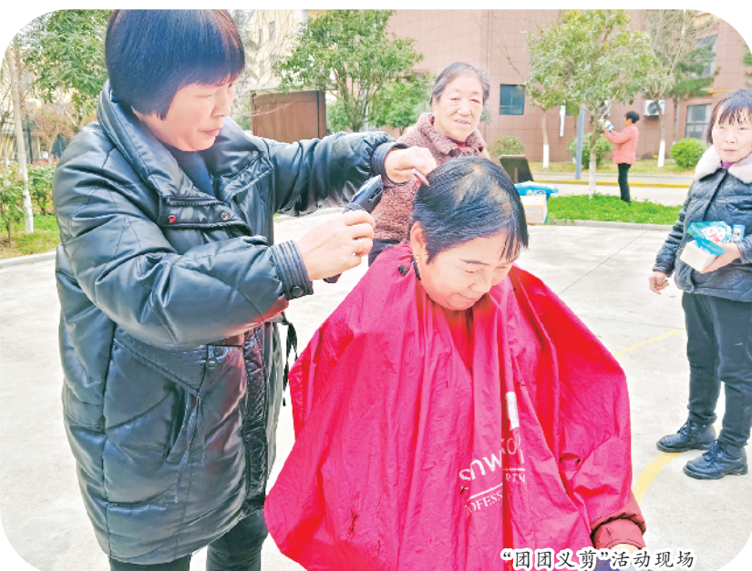
“团团圆圆”活动现场

修剪头发;义诊区域,医护人员认真为居民测量血压、血糖,进行健康检查;团县委为居民发放实用的礼品。 此次活动,以学雷锋为契机,整合多方资源,将知识普及、志愿服务与关爱传递有机结合,不仅丰富了居民的精神文化生活,更让雷锋精神在社区落地生根。