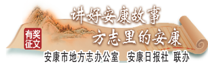
讲好安康故事 方志里的安康 安康市地方志办公室 安康日报社 联办