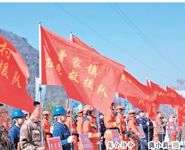
集合待命

通过此次实战演练,该县进一步检验了森林防火应急预案的可行性和有效性,提高了各相关部门的应急处置能力和协同作战水平。同时,也增强了广大干部群众的森林防火意识和自救互救能力,为筑牢秦巴生态安全屏障奠定了坚实基础。