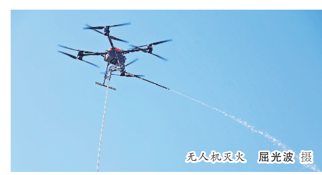
无人机灭火