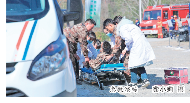
急救演练

本报讯(通讯员 姚登 屈光波 韩涛 龚小莉 郑兴亮)2月27日,镇坪县在曾家镇千山村七组李子采摘园开展2025年森林火灾扑救实战演练活动。