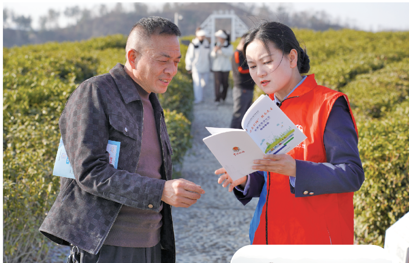
随着春季气温回升，平利县各茶产业园区焕发勃勃生机，复工复产的茶农和踏青的游客络绎不绝。

青年干部要真诚为民服务解民忧。青年干部作为为民服务的公仆，要满怀对党的忠诚和对人民的热爱。