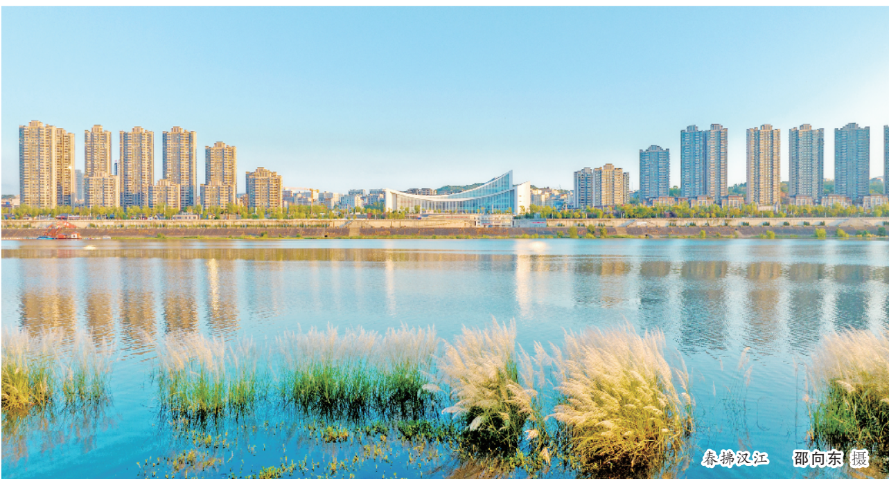
春拂汉江

“安康市中心城区优良天数达357天，较去年增加18天，超出省考市任务13天，环境空气质量综合指数为2.97，空气质量优良天数及综合指数在全省排名第一；安康城市水环境质量指数为2.9445，连续3年位列全省第一；全市重点建设用地安全利用率达100%……”一组组数据，有力见证了全市生态环境质量持续改善。 2024年，市委、市政府积极践行习近平生态文明思想，牢固树立绿水青山就是金山银山的理念，明确提出安康生态环境质量要在全省“争第一、当冠军”，并启动实施污染防治攻坚战提升工程。市委主要领导定期安排部署相关工作，市政府主要领导采用“集中调度+一线调研”的方式，将问题解决在一线、工作推进到基层。期间，累计召开调度会46次，整改问题573个，有力推动了全市生态环境质量不断提升。