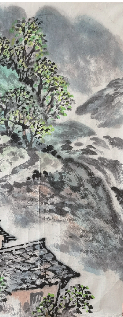
化龙山春景 谢莹作