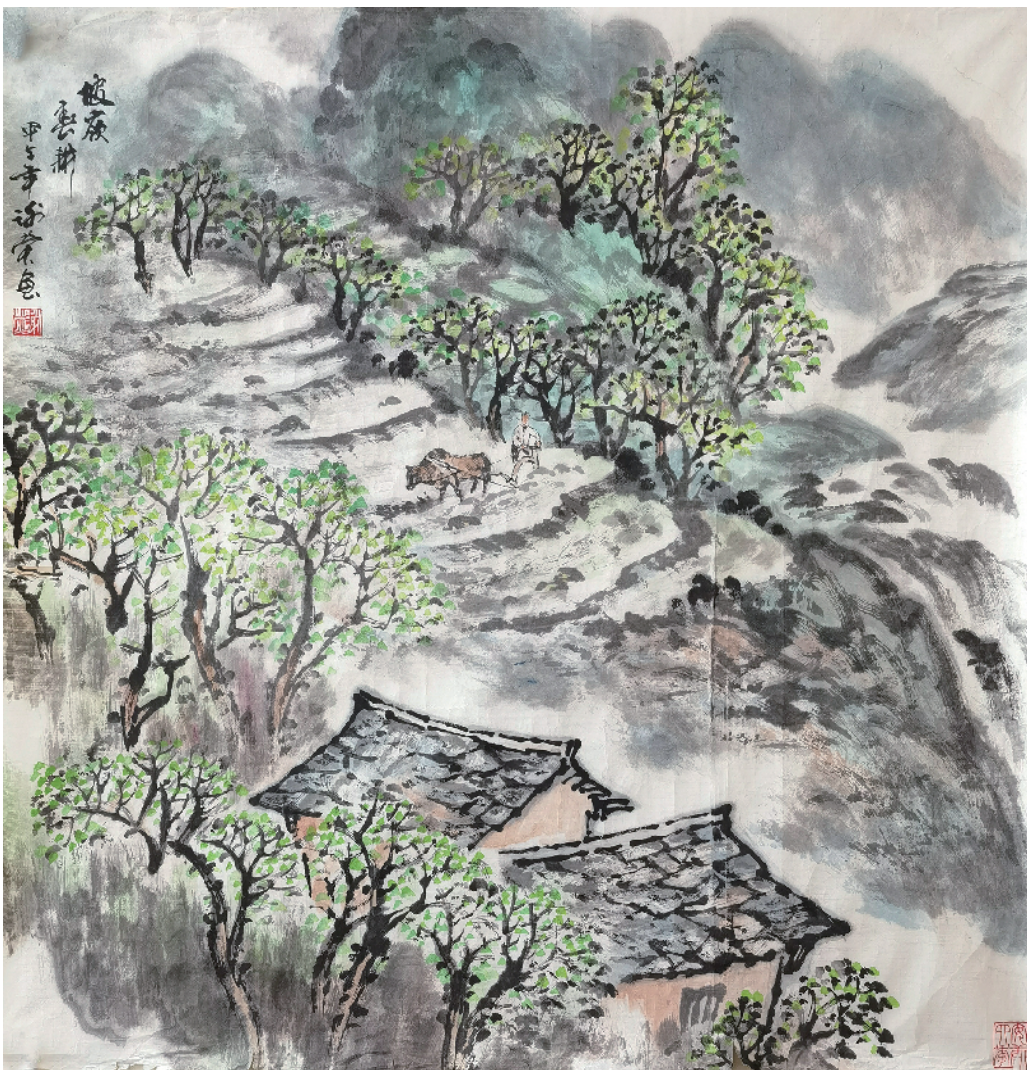
化龙山春景 谢莹作

化龙山之春，是自然与人文共谱的复调。这里没有刻意的雕琢，只有云雾在峰峦写意，溪流于石间谱曲，而每一片新叶的舒展，都是大地本真的诗行。若你向往一场触及灵魂的春日邂逅，不妨走进这“生物基因库”，让山风吹走尘嚣，让清泉洗去疲惫，在高山之巅，在林海深处，聆听生命最初的回响！