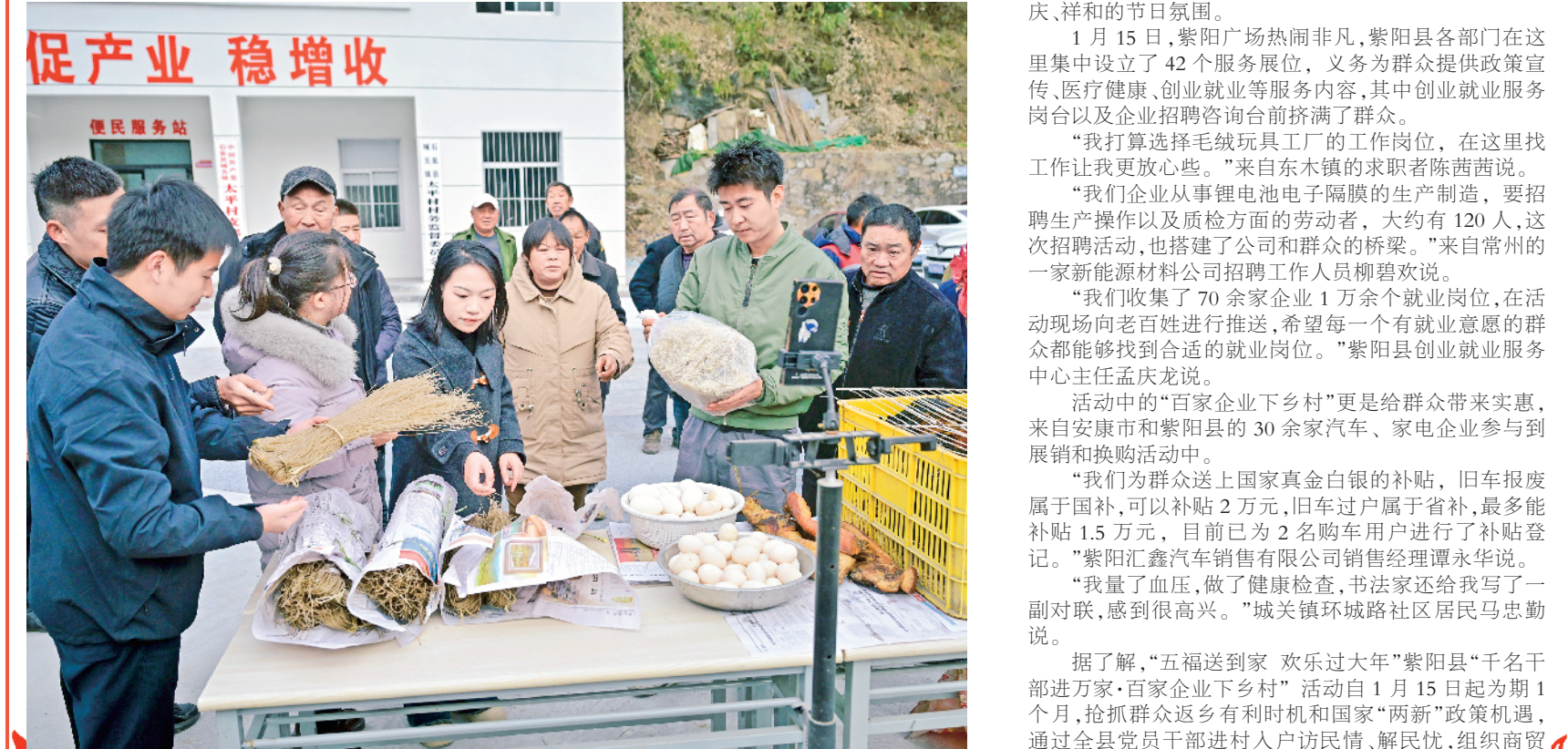
石泉县城关镇“第一书记服务团”利用资源优势,以抖音直播、微信朋友圈等新兴媒体深入开展消费帮扶活动,帮助农户销售腊肉、土鸡、粉条、土鸡蛋等特色“年味”产品,进一步拓宽农产品销售渠道,增加农户收入。