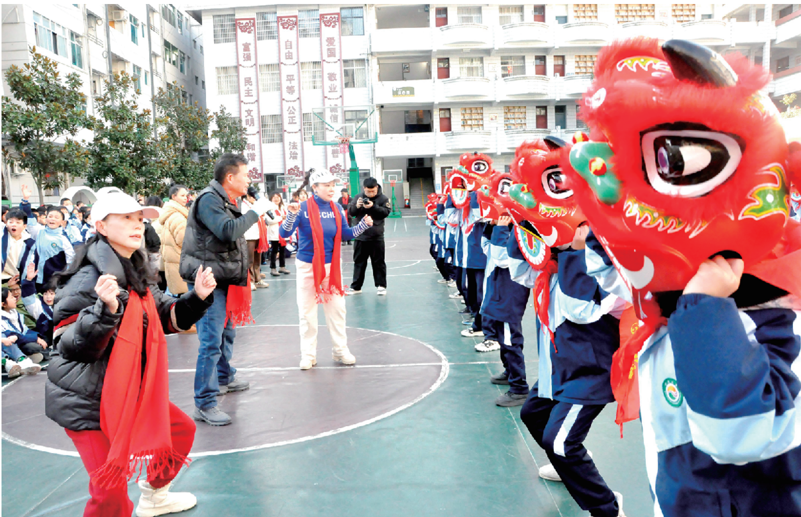
紫阳县城关第一小学日前开展传统文化进校园活动，孩子们在老师的带领下，表演了舞龙舞狮等传统民俗表演，弘扬中华优秀传统文化，增强文化自信。近年来，紫阳县开展了普及、传承、弘扬、繁荣紫阳民歌、社火表演进校园活动，组织非遗文化传承人进学校，以推广紫阳优秀传统文化。

在监督检查过程中，该镇纪委对发现的问题进行及时梳理和反馈，并责令相关村和干部进行整改。近3个月来，开展重点工作督查两次，下发检查通报两期，责令12个村整改相关事项32条，提高了镇、村干部的工作效率和服务水平，推动了各项重点工作的高效开展。