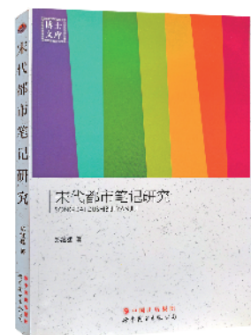
《宋代都市笔记研究》