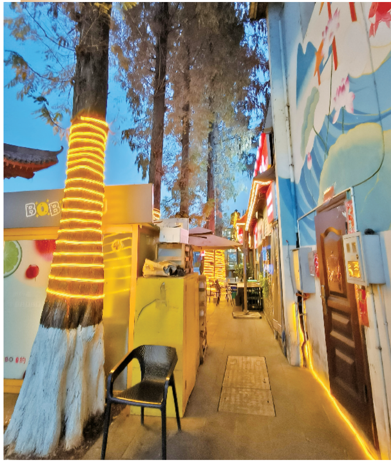
每到夜幕降临上河街灯火通明

安康龙舟文化园已经成为我市一江两岸重要的景观地,对于提升城市形象、促进地方经济发展起到了重要作用。