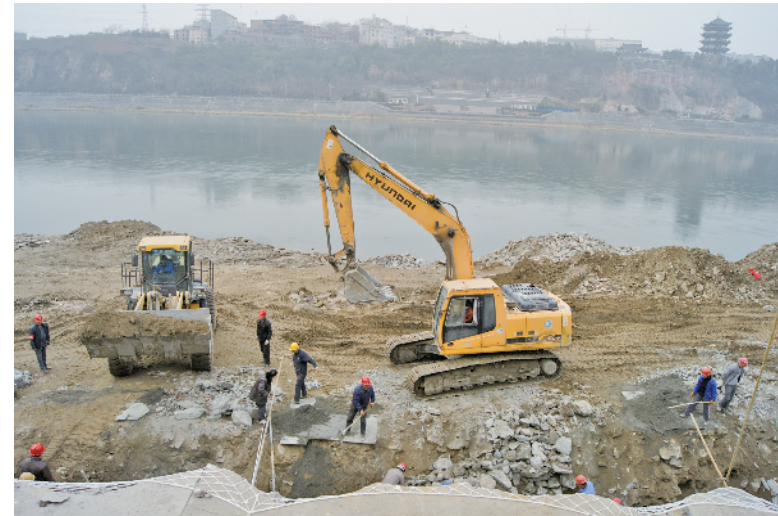
施工中的上河街龙舟文化园