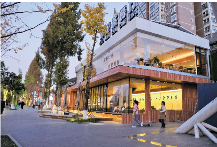
如今的上河街成为市民假日观景、品茗、休闲、就餐的好去处