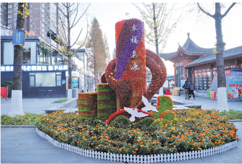
上河街入口处的“幸福安康”几个大字