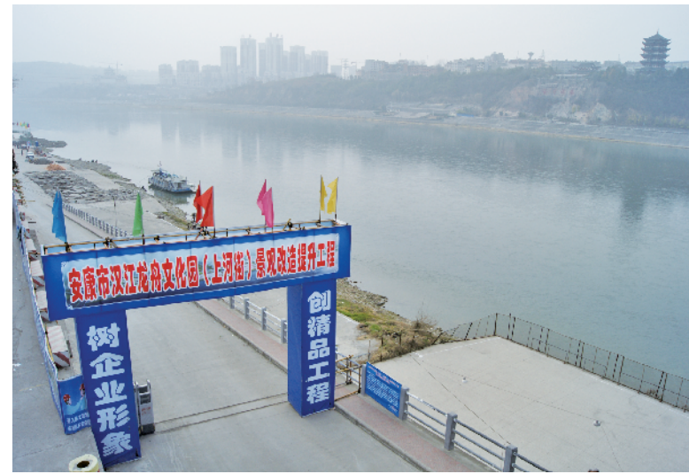
10年前上河街功能提升项目开始施工