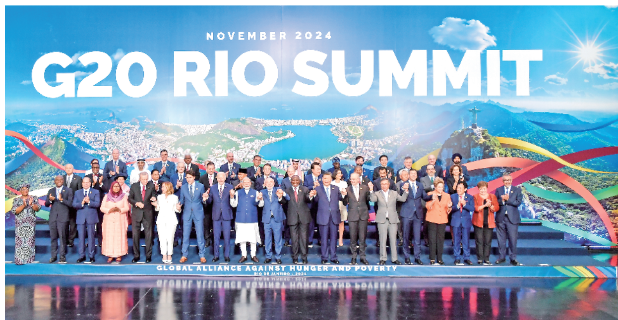
当地时间11月19日中午，国家主席习近平在里约热内卢出席二十国集团领导人第十九次峰会闭幕会议。这是闭幕会议后，习近平同与会领导人合影。

新华社里约热内卢11月19日电 当地时间11月19日中午，国家主席习近平在里约热内卢出席二十国集团领导人第十九次峰会闭幕会议。蔡奇、王毅陪同出席。