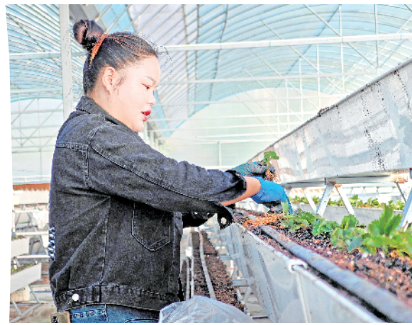
10月22日,汉阴县笃敬产业园工人正在进行高架草莓移栽工作。

今年以来,该镇累计争取实施市级重点项目3个、县级项目5个、衔接资金项目12个,新培育“五上”企业1家,新增市场主体19家,工业企业产值增长40.3%。