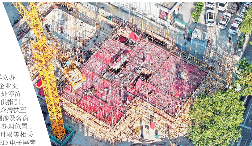
10月25日,在宁陕县城投·幸福里建设项目现场,工人们正在进行模板定型、钢筋绑扎施工作业。

志愿服务活动,及时协助群众办事,为前来办事的群众和企业提供优质服务。对在大厅门口处停留及上前询问的群众,主动提供指引、咨询服务,对行动不便的群众搀扶至相关窗口。对群众咨询问题涉及各窗口审批服务事项的,就具体办理位置、申报材料、办事程序、办理时限等相关内容进行解答。大厅一楼LED电子屏旁边设立“爱心驿站”,提供爱心药箱、失物招领、免费阅读、免费饮用水、便民雨伞等。