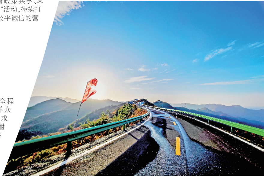
10月22日,平利渡正路(渡船口至正阳大草甸)沥青混凝土路面完成大部分铺装。

次性告知制度”和“办理+全程代理制度”,最大限度为群众提供便利服务。同时,要求工作人员要热情周到、耐心细致,做到群众利益无小事,把群众的事当成自己的事来办,全面树立良好的基层干部形象,聚力建设和幸福麻坪。