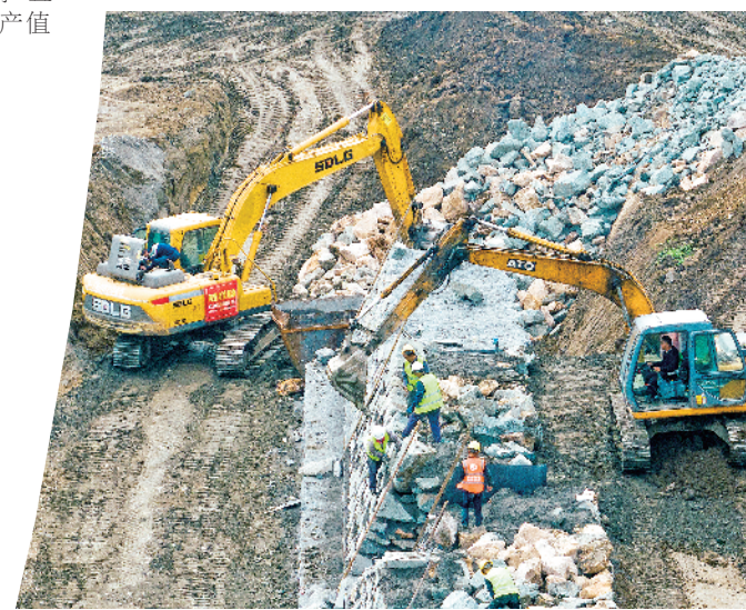
10月23日,汉江石泉县城关镇杨柳防护区(右岸)综合治理项目正加紧建设。

所、用工、融资、社保等方面面临的突出困难和问题。通过群众身边不正之风和腐败问题集中整治、“铁拳行动”等工作,累计检查加工制作肉制品经营主体169家次,发现整改问题117个,检查校园食堂468家次,发现整改问题391个,整改外卖餐饮无餐食封签等问题32个。通过开展诚信市场“五个一”建设、“手机变扫码计量惠民生”、食品安全“红黑榜”、与辖区企业开展“监管政策共学、风险隐患共查、清正廉洁共促”活动,持续打造政商亲清、放心消费和公平诚信的营商环境。