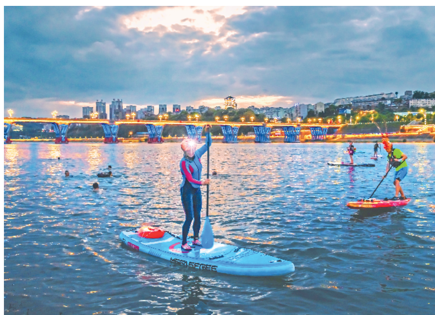
市民在安康湖玩浆板