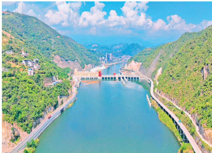
旬阳水电站蓄水至 237 米高程