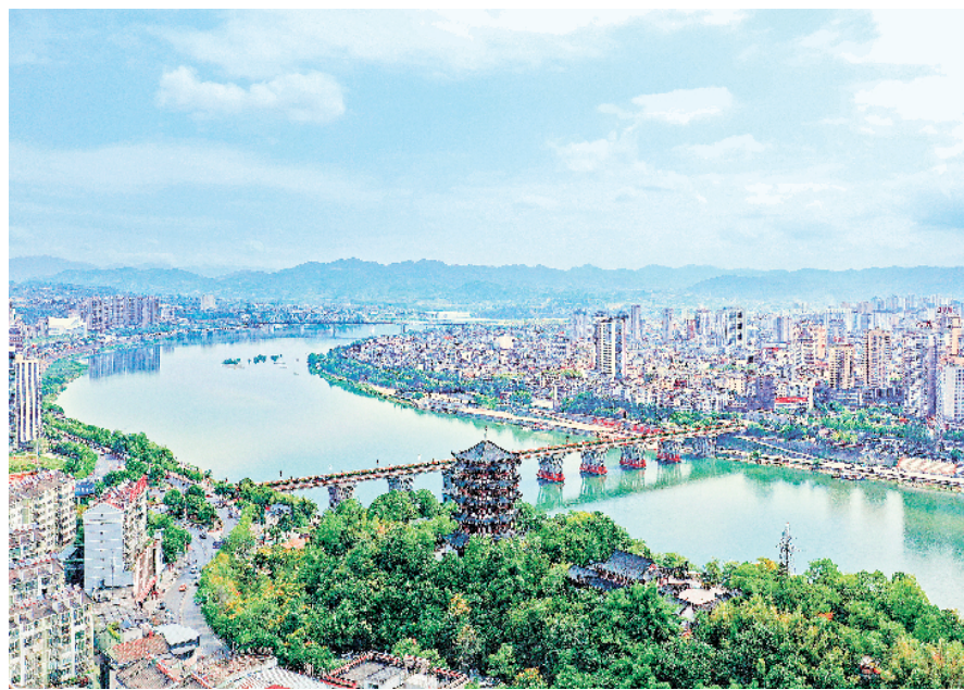
旬阳水电站蓄水后呈现湖城一体的美丽景观