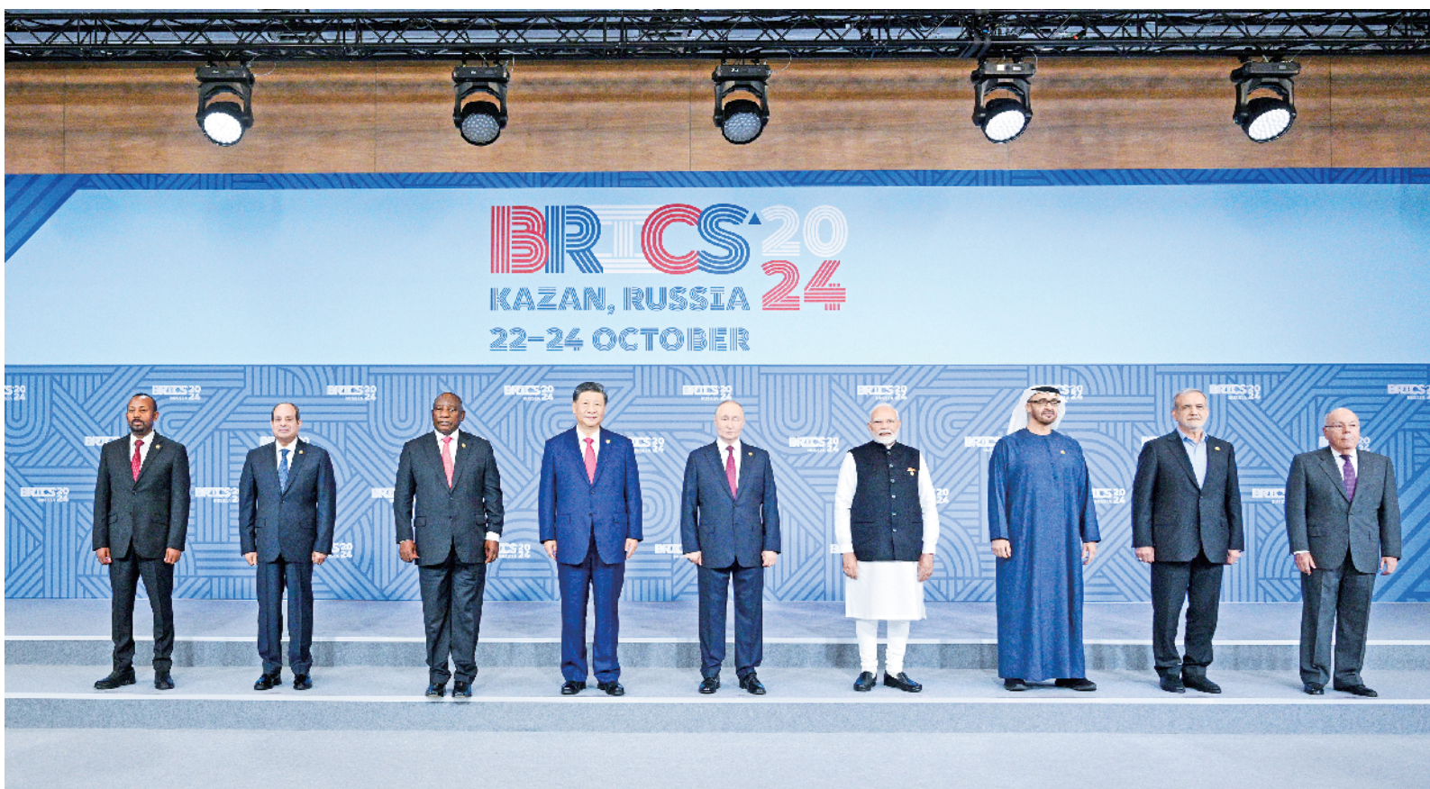
当地时间10月23日上午，金砖国家领导人第十六次会晤在喀山会展中心举行。俄罗斯总统普京主持会晤。中国国家主席习近平、巴西总统卢拉（线上）、埃及总统塞西、埃塞俄比亚总理阿比、印度总理莫迪、伊朗总统佩泽希齐扬、南非总统拉马福萨、阿联酋总统穆罕默德等出席。这是会晤期间，金砖国家领导人集体合影。