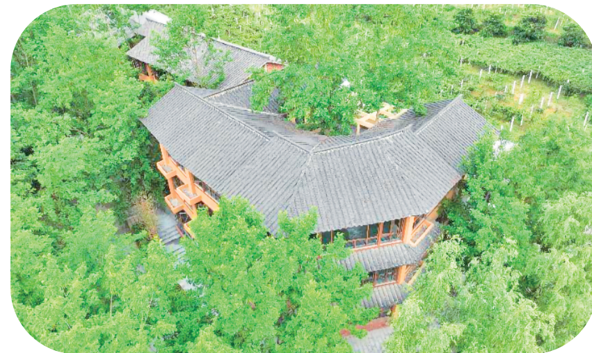
本草溪谷省级森林康养基地