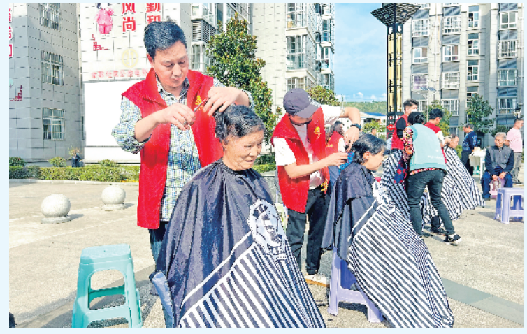
▲10月10日,在汉阴县紫云南搬迁社区,志愿者为这里的老人义务理发,用实际行动为老人们送上节日祝福。