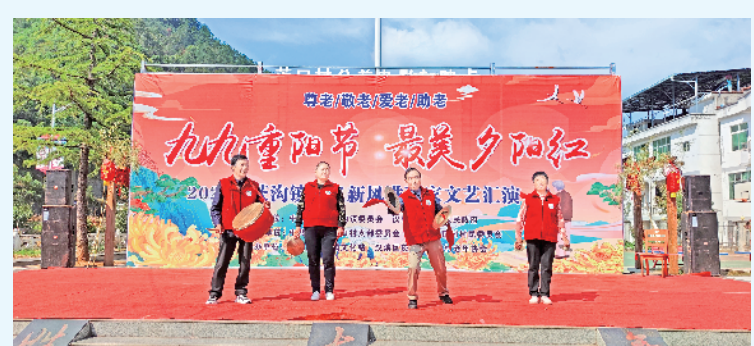
▲10月9日,汉滨区文旅广电局联合茨沟镇茨口村举办了“九九重阳节 最美夕阳红”孝义新风进万家文艺活动。活动以“尊老、敬老、爱老、助老”为主题,茨沟镇茨口村老年协会分会还为本村98名老年人统一购买了红马甲和过冬的皮鞋,让老人们度过一个幸福快乐的重阳节。