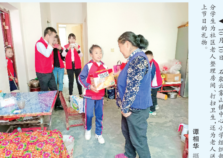
▲10月20日,安康汉水阳光怡养园城东分院携手江北街道张沟桥社区,举办了一场别开生面的文艺演出,为这里的老人送上节日祝福。郑团吉 摄