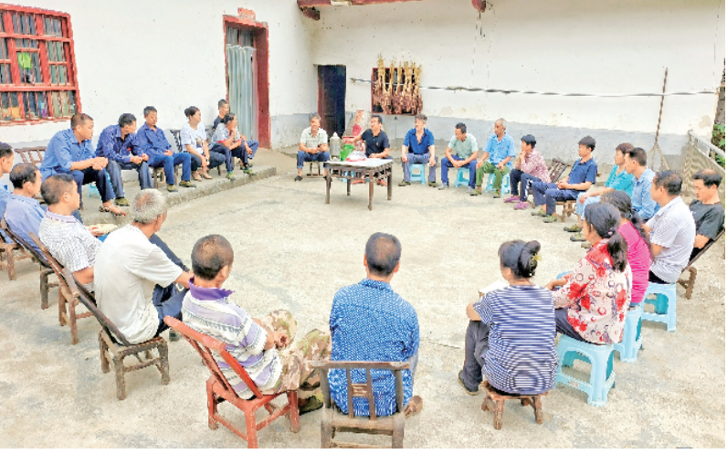
平利县兴隆镇马鞍桥村以公路为线、居民区为点,持续推进人居环境整治,改善群众生产生活条件。图为该镇干部召开院落会,安排环境整治工作。王辑 摄