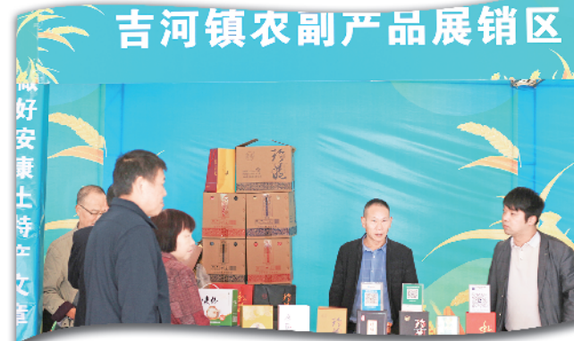
吉河镇农副产品展销