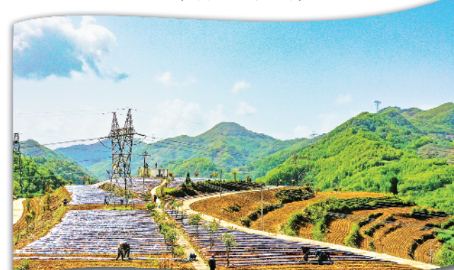
福滩村烤烟种植基地