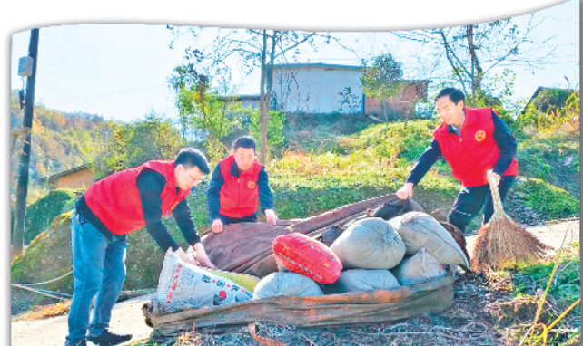
纸坊村四支队伍干部开展人居环境整治