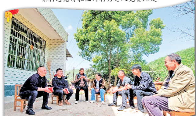
镇村干部通过院坝会向群众宣讲党的政策