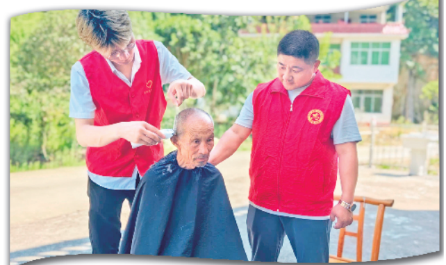
镇村志愿者在江河村为老人免费理发