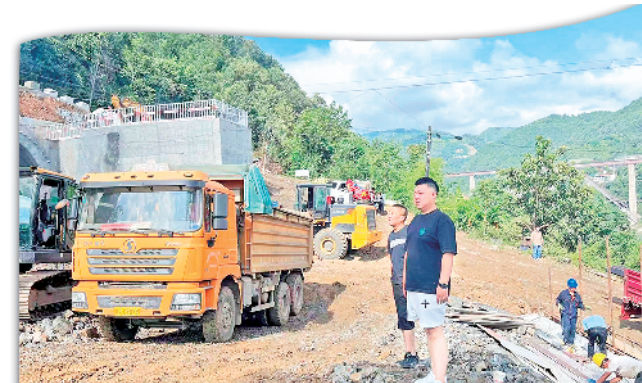
揭榜挂帅干部在重点项目建设现场协调