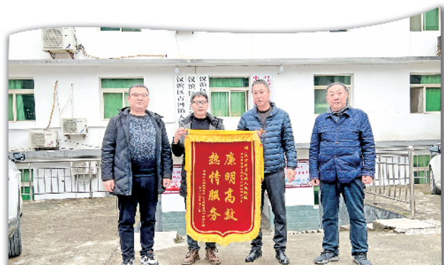
中铁十九局康渝高铁一标项目部为吉河镇赠送锦旗