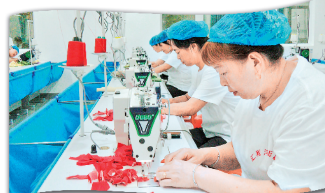
前进社区工厂一角