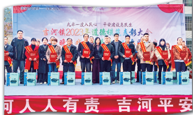
吉河镇道德模范暨先进典型表彰