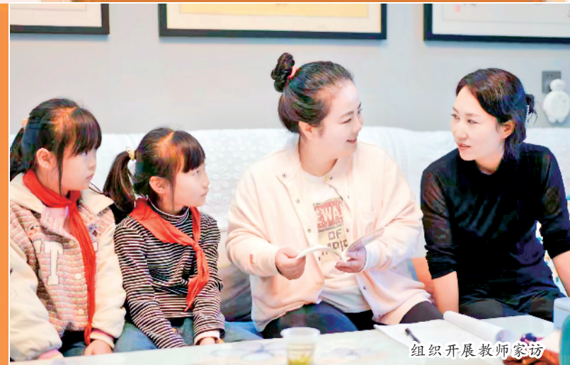
组织开展教师家访