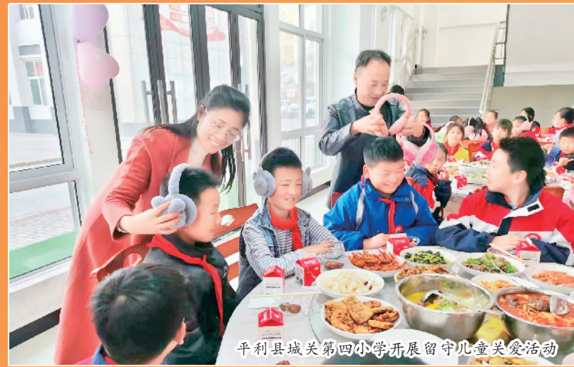
平利县城关第四小学开展留守儿童关爱活动