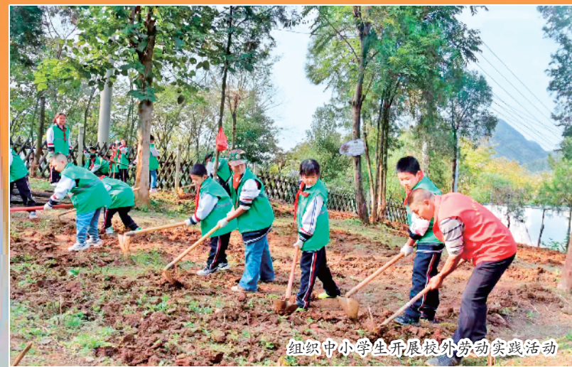
组织中小学生学习校外劳动实践活动