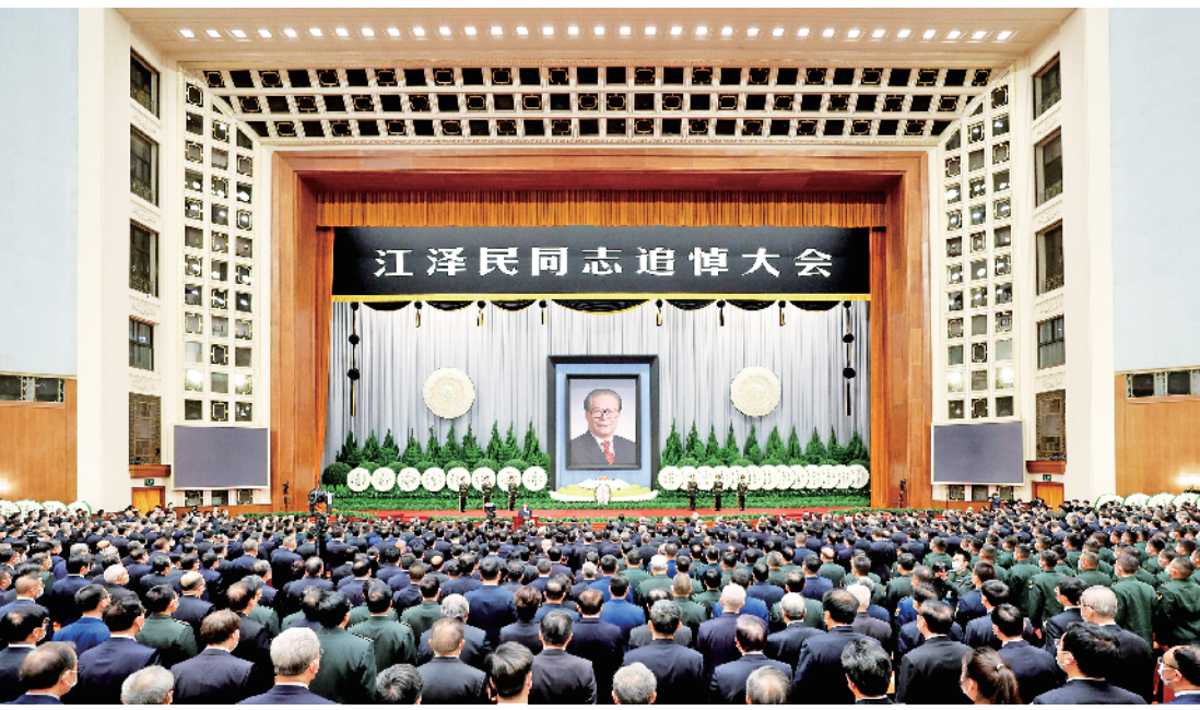
12月6日，中共中央、全国人大常委会、国务院、全国政协、中央军委在北京人民大会堂隆重举行江泽民同志追悼大会。

1985年后，江泽民同志任上海市市长，上海市委副书记、书记。他领导制定上海经济发展规划和城市建设规划，提出在20世纪末把上海建设成为开放型、多功能、（下转二版）