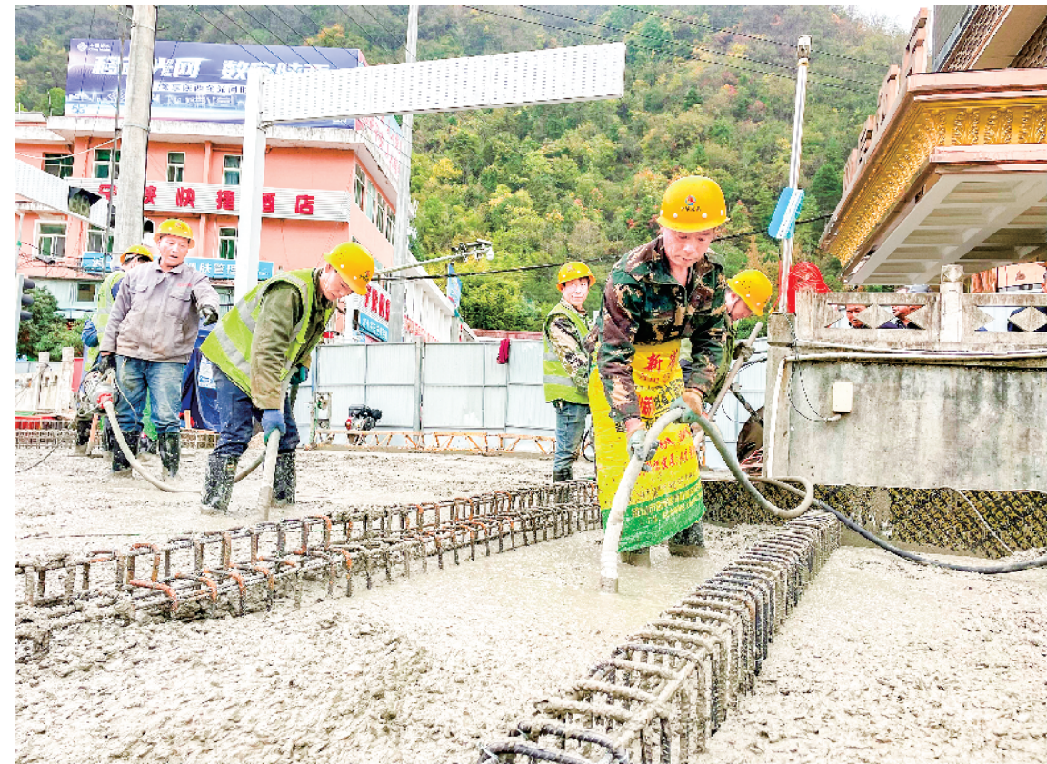
宁陕县住房和城乡建设局近日抢抓工期，开展迎宾桥提升改造工程，全面组织人力、机械对城内道路进行规范化施工作业。

施；应用分子诊断、人工智能诊断等技术，提升致残疾病早期发现能力。不断推进残疾预防科技创新、制度创新，积极探索可复制、可推广的残疾预防工作新模式、新经验、新成果，确保到2025年高质量完成旬阳市建设全国残疾预防重点联系地区各项任务。