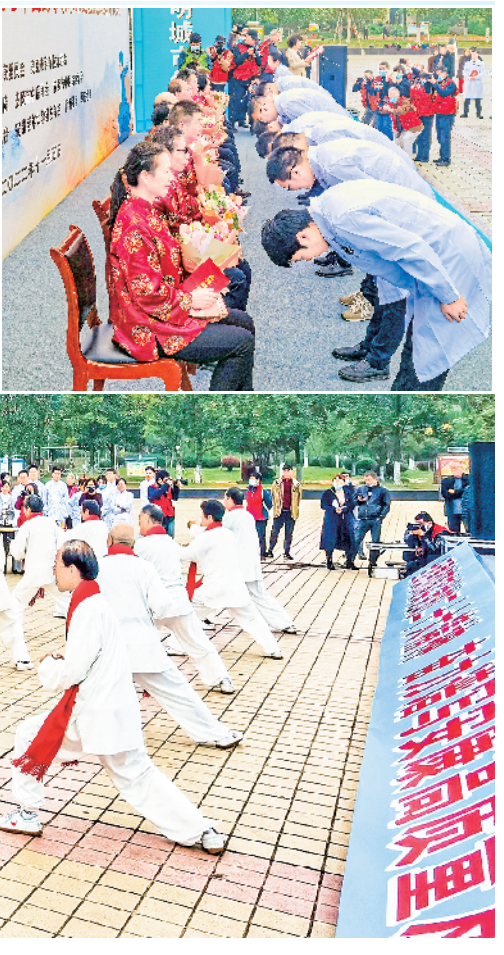
为促进我市中医药传承创新发展，11月5日，由市卫健委、市科协主办，市中医院承办的第八届中国药方启动仪式暨全国第七批、市中医院第五批老中医药专家学术经验继承拜师仪式在安康城区金州广场举行。