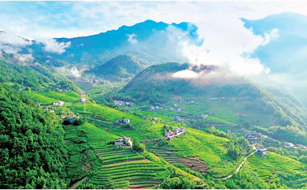
盛夏时节,地处岚皋县南官山镇桂花村的千亩古梯田在云雾中若隐若现,宛如人间仙境,如诗如画。近年来,该村通过“合作社+农户”的发展模式,实行统一耕种、统一销售,形成了完整的有机水稻产业链;目前,这片梯田已种植水稻960亩,预计年产水稻100万斤,带动周边群众人均增收2000多元。

口前移、重心下移,源头治理多元化解信访矛盾,切实做到发现在早、防范在先、处置在小。要按照“三到一处理”原则,切实解决信访突出问题,依法维护正常信访秩序,坚决打赢信访积案化解攻坚战。要加快完善信访联席会议机制,扎实开展“全国信访工作示范县”创建活动,持之以恒抓基础、抓源头、抓排查,推动问题解决在基层、化解在萌芽状态。 会上,5个县区和5个市直重点部门作了表态发言,签订了市对县《信访工作重点任务责任清单》。