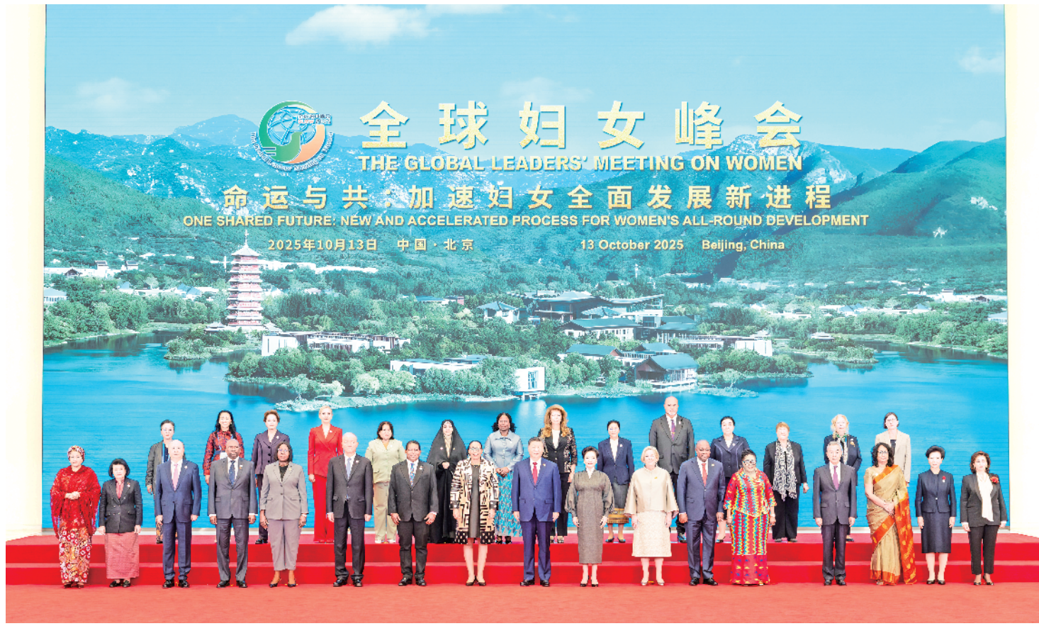
10月13日上午，国家主席习近平在北京国家会议中心出席全球妇女峰会开幕式并发表主旨讲话。这是习近平和夫人彭丽媛与会各国和国际组织代表团团长夫妇合影留念。

新华社北京10月13日电(记者 马卓言 董博婷)10月13日上午，国家主席习近平在北京国家会议中心出席全球妇女峰会开幕式并发表主旨讲话。