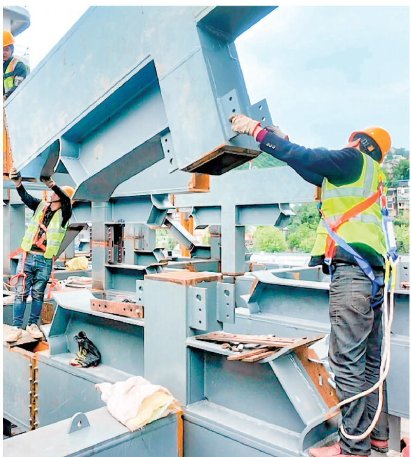
日前,在旬阳太极城综合文化旅游服务中心建设现场,一线施工员工正以饱满的工作热情投入生产。该综合性项目由康养酒店与住宅两大板块构成,康养酒店已顺利完成主体封顶,全面转入钢结构安装阶段。