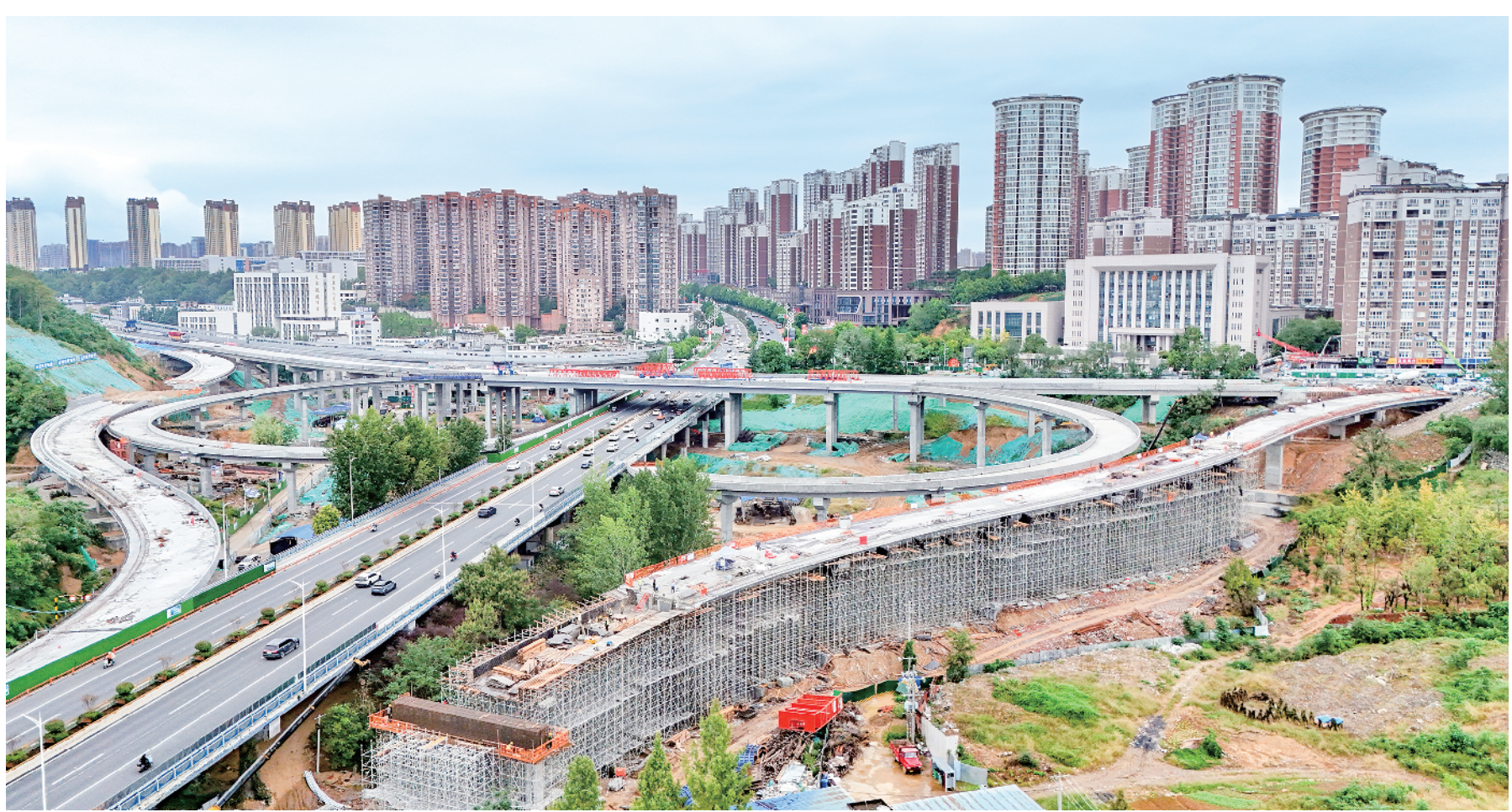
日前,安康七里沟立交桥项目建设现场,工人正在进行路面铺设工作。

坚持标准不降,提高绩效评价质量。从预算编制开始阶段,将“双监控”结果作为项目资金调整的重要依据,扎实开展项目重点绩效评价。通过重点评价,全面检视财政资金花得值不值、效果好不好,做实闭环管理。坚持“评用结合、有评必用”原则,将绩效评价结果运用于预算安排、完善政策、改进管理、资金分配,提高预算绩效管理水