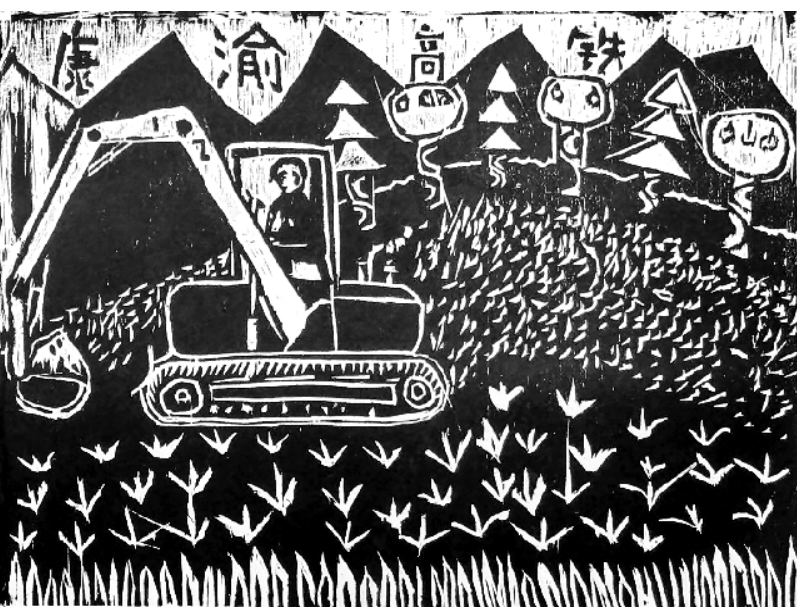
《山村建设忙》 张明月 10岁