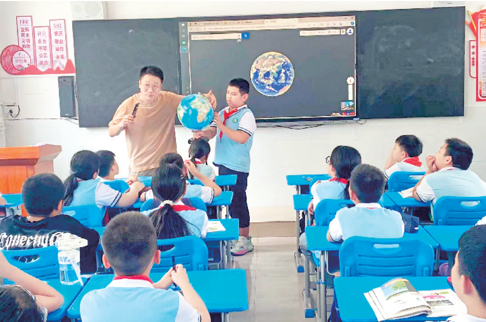
支教老师在课堂上用生动有趣的方式拓宽了山区学生的知识面

千里支教山海情深,携手奋进共谱新篇。每一位支教老师与镇坪教师如同涓涓细流一般,将自己对教育事业的热爱和付出汇聚成大江大河,一同承载着对两地教育事业高质量发展的责任与重担。而作为钟楼区教育人,在镇坪这片热土上,他们传递教学理念、推进教育改革创新、互动促进共同成长,不断赓续着教育帮扶的初心和使命。