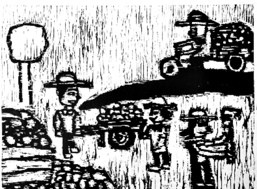
《开矿者》 张明玉 二岁