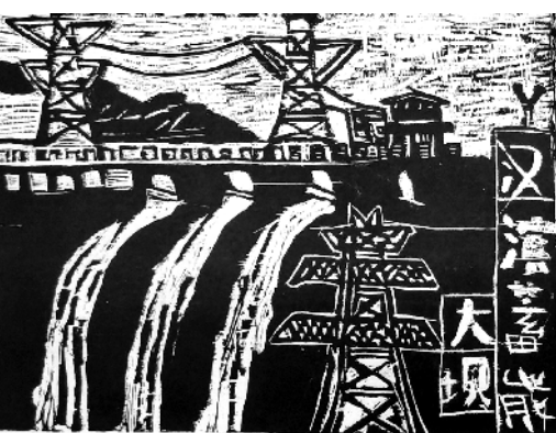
《大坝建在我家乡》 陈庭松 二岁