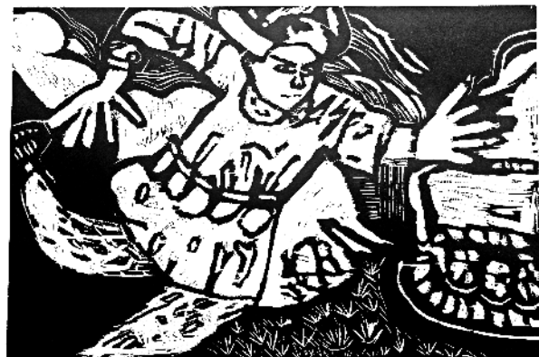
《黄继光》 汪艳 二岁