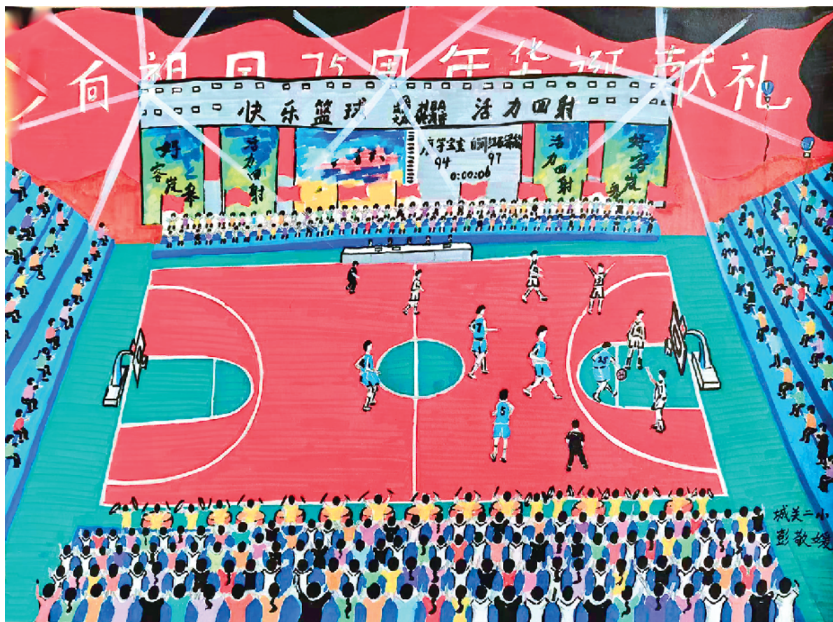
《凤泉“村BA”火了》 彭敬媛 10岁