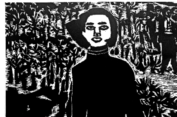
《刘胡兰》 胡方婷 二岁