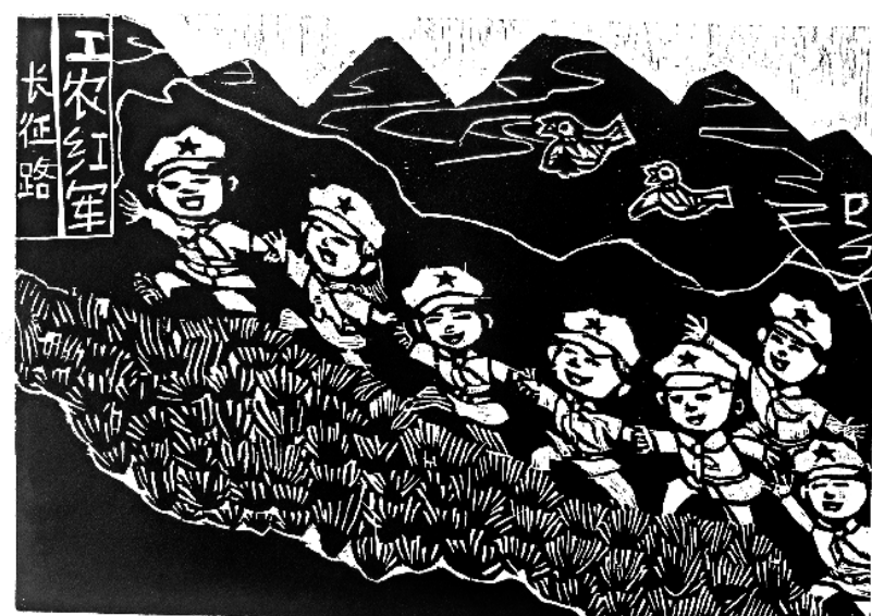
《少先队员重走长征路》 寇媛媛 10岁