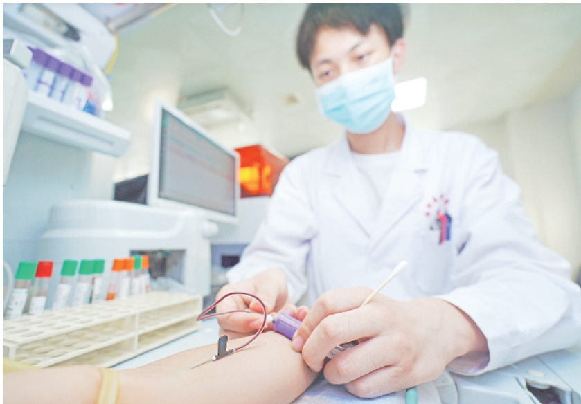
该院检验科为群众抽取血液样本