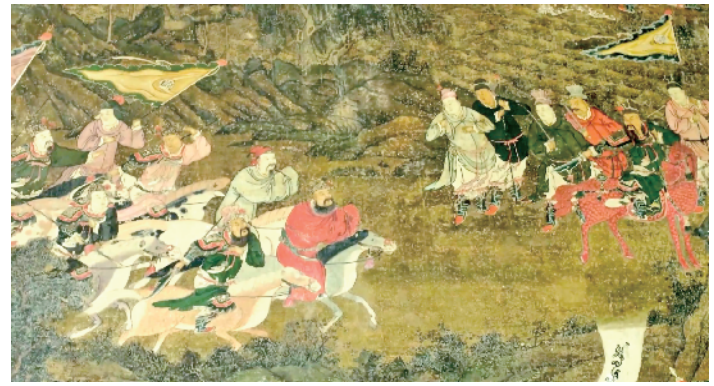
五省会馆正殿墙上的壁画二