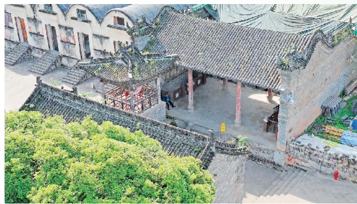
五省会馆近景一角