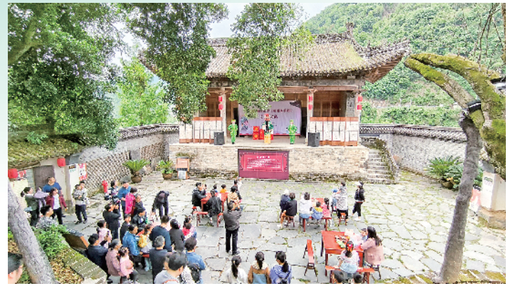
在五省会馆举行紫阳民歌展演