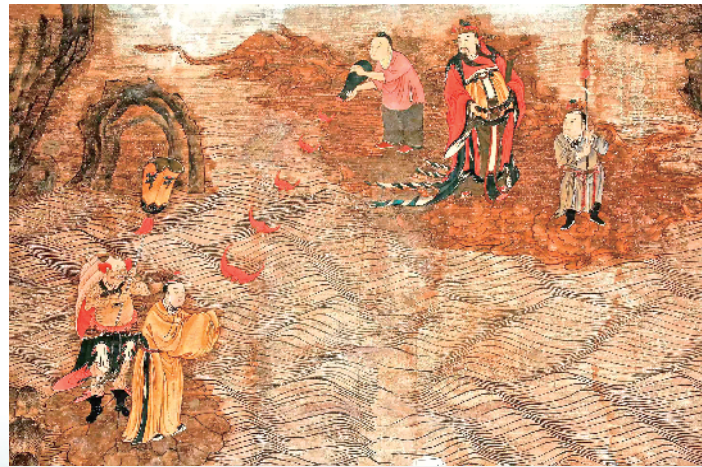
五省会馆正殿墙上的壁画一