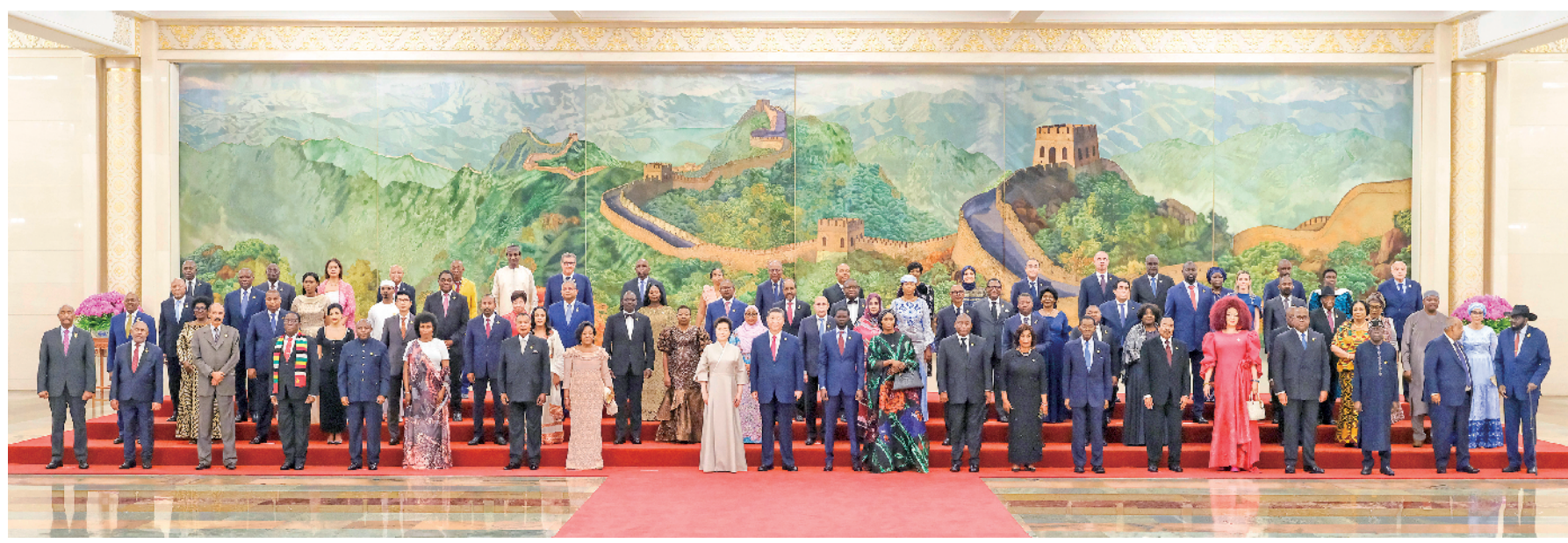
9月4日晚,国家主席习近平和夫人彭丽媛在北京人民大会堂举行宴会,欢迎来华出席中非合作论坛北京峰会的非方及国际贵宾。这是宴会前,习近平和彭丽媛同贵宾们集体合影留念。

新华社北京9月4日电(记者 温馨 董雪)9月4日晚,国家主席习近平和夫人彭丽媛在北京人民大会堂举行宴会,欢迎来华出席中非合作论坛北京峰会的非方及国际贵宾。中共中央政治局常委李强、赵乐际、王沪宁、蔡奇、丁薛祥、李希出席。 9月的北京,秋高气爽。雄伟的人民大会堂内,中国国旗和中非合作论坛成员国国旗以及非洲联盟旗帜交相辉映。 出席论坛峰会的51个非洲国家元首、政府首脑及配偶,2位总统代表,非盟委员会主席和联合国秘书长等贵宾陆续抵达人民大会堂。习近平和彭丽媛热情迎接,同他们分别握手问候,并集体合影留念。