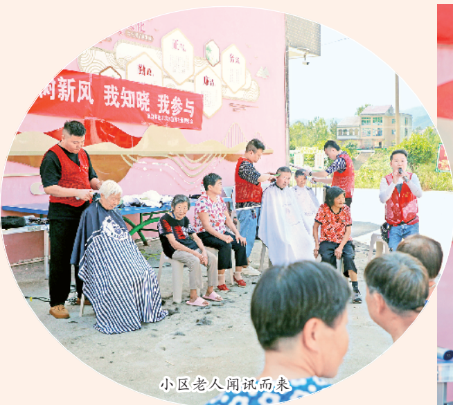
小区老人闻讯而来